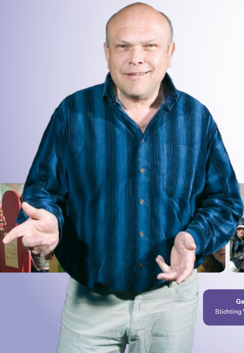
Geu Visser Stichting Vredeseducatie

“Ouders kwamen kijken op een ouderavond, waar ze de tentoonstelling konden bekijken. Een ouderpaar belde ter plekke hun zoon, en vroegen of hij écht de uitspraak had gedaan die ze daar lazen: ieder mag zijn eigen mening hebben, daarvoor moet je respect hebben.”