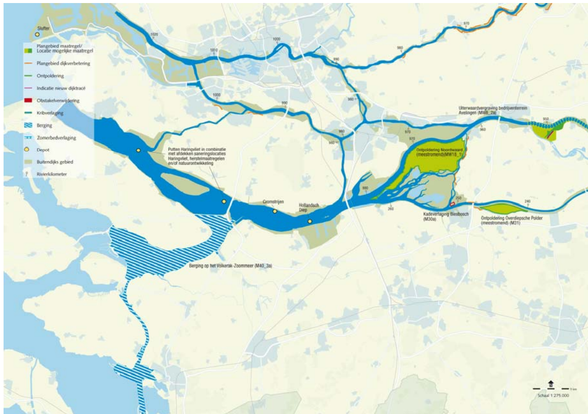
Kaart 2: Basispakket en depots voor de korte termijn Benedenrivierengebied