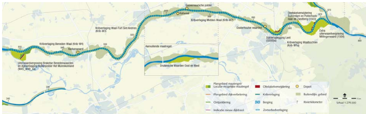
Kaart 1: Basispakket, alternatieven, aanvullende maatregelen en depots voor de korte termijn Boven-Rijn en Waal