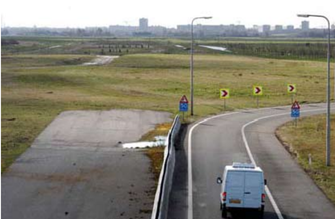
Minister Eurlings wil snel rechtdoor.

Als het aan minister Eurlings ligt, wordt de A4 tussen Delft en Schiedam eindelijk aangelegd. Op 16 januari heeft hij de Tweede Kamer hierover een brief gestuurd. Het gaat om 7 kilometer waarover al decennia wordt gepraat maar niets besloten.