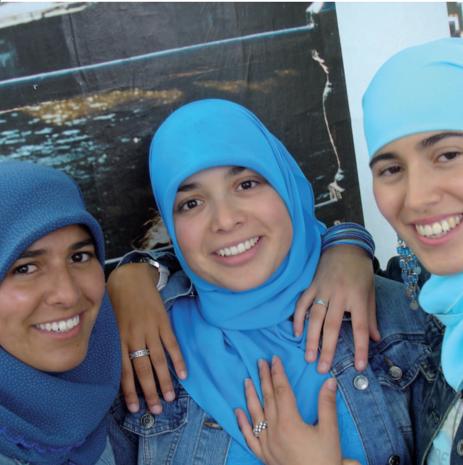
De Meiden van Halal, NPS