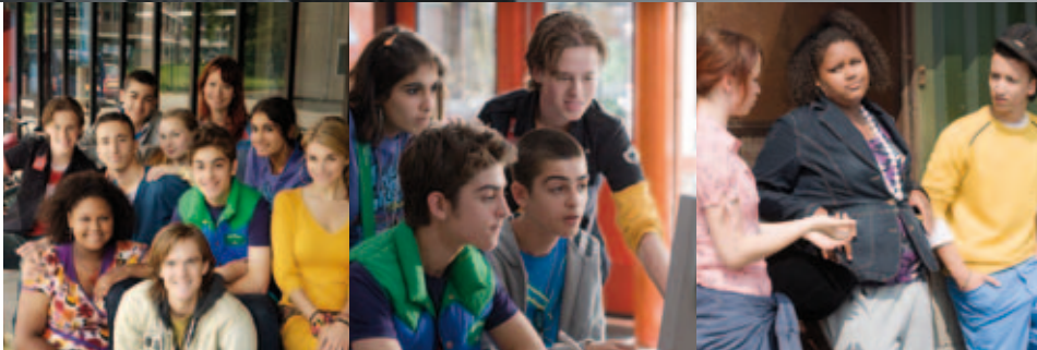
Het Lagerhuis, VARA SpangaS, NCRV