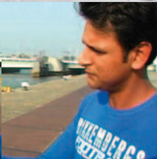
Raymann is Laat, NPS