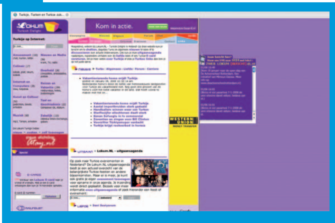
Lokum.nl_Turkije, Turken en Turkse zaken

internet, en dat dit consequenties heeft voor de organisatie en het aanbod van lokale omroepen, maar heeft nog geen toekomstvisie geformuleerd. Zoals de WRR al concludeerde hebben vele organisaties de ambitie om het internetportal te worden in het informatie- of cultuurdomein. De komende jaren zullen waarschijnlijk verschillende organisaties elkaar op dit terrein beconcurreren om de aandacht van het publiek, de euro's van adverteerders en subsidies van de overheid.