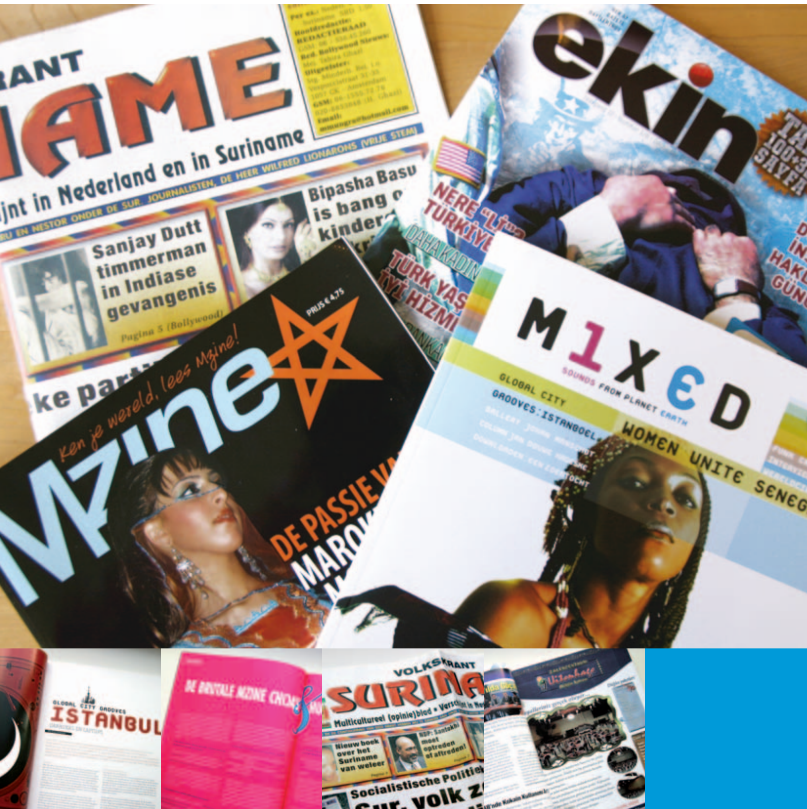
Tijdschriften: Mixed, Mzine, ekin en Volkskrant Suriname VLNR: binnenpagina: Mixed, Mzine, voorkant: volkskrant Suriname, binnenpagina: Ekin