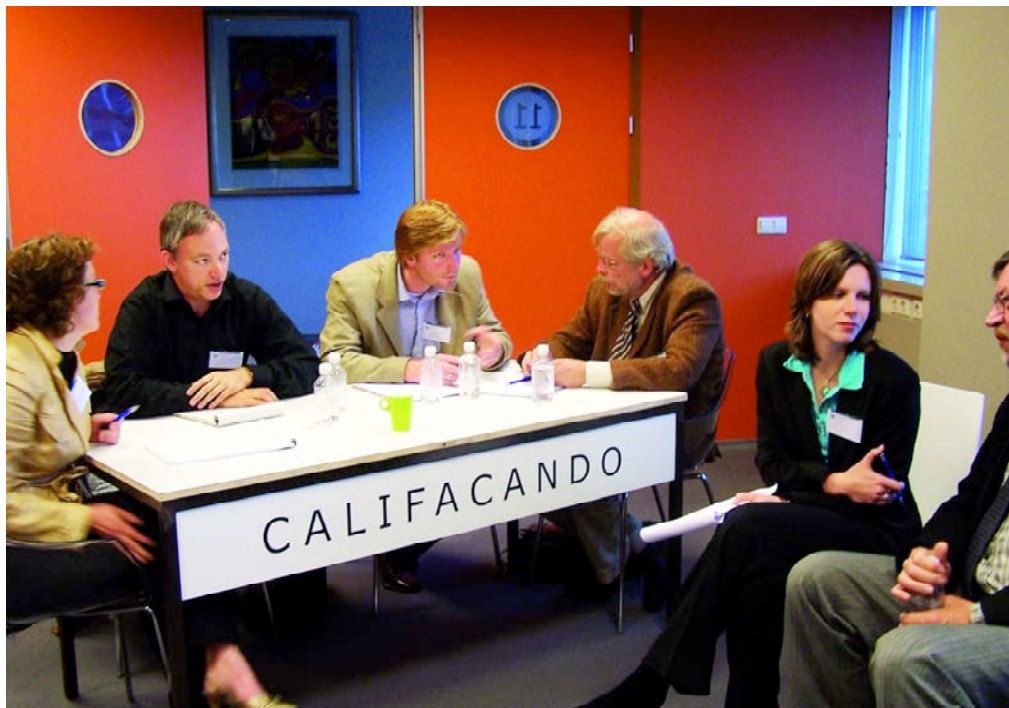
De deelnemers aan de workshop pleitten voor een gezamenlijke uitvoering van de faunabeheerplannen over de grenzen van gebieden heen.