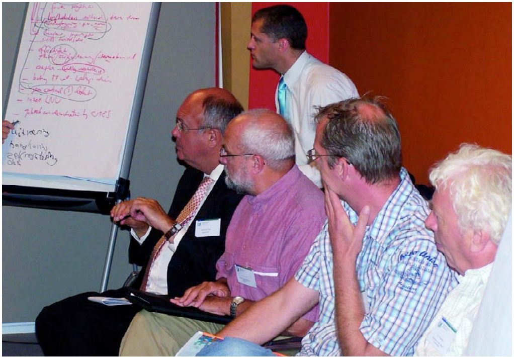
Er bleek onder de aanwezigen veel behoefte aan het aanvragen van CITES-documenten per Internet.