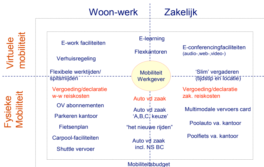
Figuur: Menukaart werkgevers

De Mobiliteitsmakelaar helpt aan onder meer met behulp van een 'breed samengestelde menukaart'. Onderstaand plaatje geeft hiervan een indicatie.