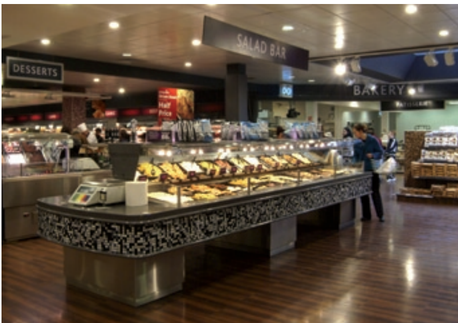
De vernieuwde Superquinn, de supermarktketen die tot 2005 eigendom was van de Quinn familie. Het is nu een dochteronderneming van Select Retail Holdings Limited.

De uitzonderlijke Ierse economische groei kan toegeschreven worden aan de Europese steun van cohesiefondsen, maar ook andere elementen hebben hiertoe bijgedragen. Ierland heeft een jonge, goed opgeleide bevolking, een dynamisch beleid voor het aantrekken van buitenlandse investeringen