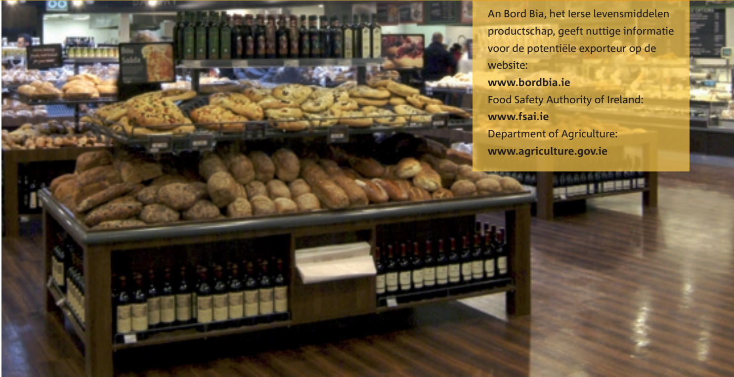
Die Ierse markt biedt goede kansen voor de afzet van Nederlandse producten.

in de belangstelling staan. De consument wil functional food producten met een lager vet/zout/suikergehalte en is eveneens zeer geïnteresseerd in biologische producten. Levensmiddelen uit andere EU-landen, zowel vers als verwerkt, zijn bijna overal verkrijgbaar. De Ierse consument kiest net zoals in andere lidstaten steeds meer voor kwaliteit bij het inkopen van levensmiddelen en is bereid daarvoor ook wat meer te betalen. Een andere belangrijke ontwikkeling is het brede assortiment van levensmiddelen en dranken in de winkels bij tankstations en het verschijnen van supermarkten die 24 uur, zeven dagen per week open zijn. Daarnaast winnen de ‘farmers markets’ aan populariteit.