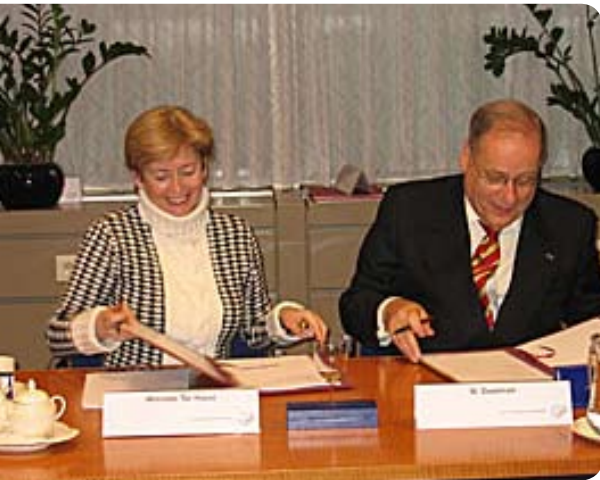
Ondertekening convenant Haaglanden

wet hanteert een geregionaliseerde brandweer wel als uitgangspunt. Vooruitlopend op het van kracht worden van de Wet veiligheidsregio's, sluit de minister van BZK convenanten af met de besturen van veiligheidsregio's. Met het ondertekenen van het convenant verbinden de veiligheidsregio's zich aan de basisvereisten crisismanagement en spreken zij de intentie uit om de brandweer te regionaliseren. Als tegenprestatie voor deze vooruitstrevendheid krijgen de regio's een extra financiële impuls. 1