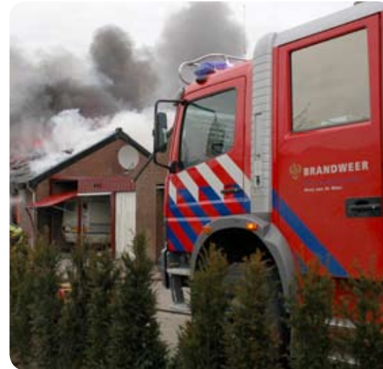
Brandweervoertuig Horst aan de Maas.

Onderzoek, onder andere van de Inspectie Openbare Orde en Veiligheid, heeft de afgelopen jaren aangetoond dat de organisatie voor rampenbestrijding en crisisbeheersing nog sterk voor verbetering vatbaar is. Op veel plaatsen bestaat nog onvoldoende samenhang en afstemming tussen de partners in crisisbeheersing. De samenwerking moet beter, de coördinatie en commandovoering moeten worden versterkt, evenals de operationele informatie-uitwisseling tussen de betrokken instanties. Met de vorming van de veiligheidsregio's beoogt de overheid deze doelen te bereiken. Daadkrachtige regionale veiligheidsorganisaties, waarin de partnerdiensten hecht samenwerken, zijn noodzakelijk om het veiligheidsniveau te realiseren waar de burger recht op heeft. De brandweer is in deze structuur nog een zwakke schakel omdat deze dienst, in tegenstelling tot politie en GHOR, nog lokaal wordt aangestuurd. Dat maakt het moeilijk om op bovenlokaal niveau harde afspraken te maken over het te realiseren kwaliteitsniveau van de brandweer.