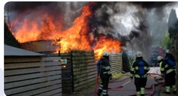
Regionalisering verandert niets aan de lokale incidentbestrijdingstaken.

Ook na regionalisering blijven de gemeentebesturen wettelijk verantwoordelijk voor het niveau van de brandweezorg per gemeente. Zij maken met de regio afspraken over de uitvoering. De regio kan dan met de beschikbare mensen en middelen, capaciteit en kwaliteit, het vereiste brandweezorgniveau voor alle gemeenten optimaal organiseren. Aan de gemeenteraden worden verschillende instrumenten aangereikt om invloed uit te oefenen op het beleid van het bestuur