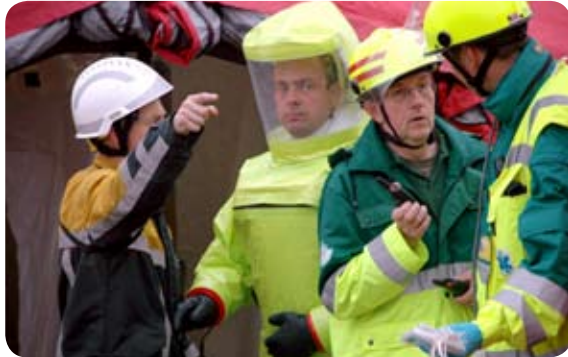
Complexe risico's vragen steeds meer kennis en deskundigheid van de brandweer.

Veel brandweerkorpsen kampen met knelpunten in hun organisatie, waardoor zij niet alle aan hen opgedragen taken op voldoende niveau kunnen uitvoeren.