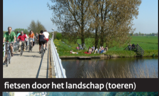
fietsen door het landschap (toeren)