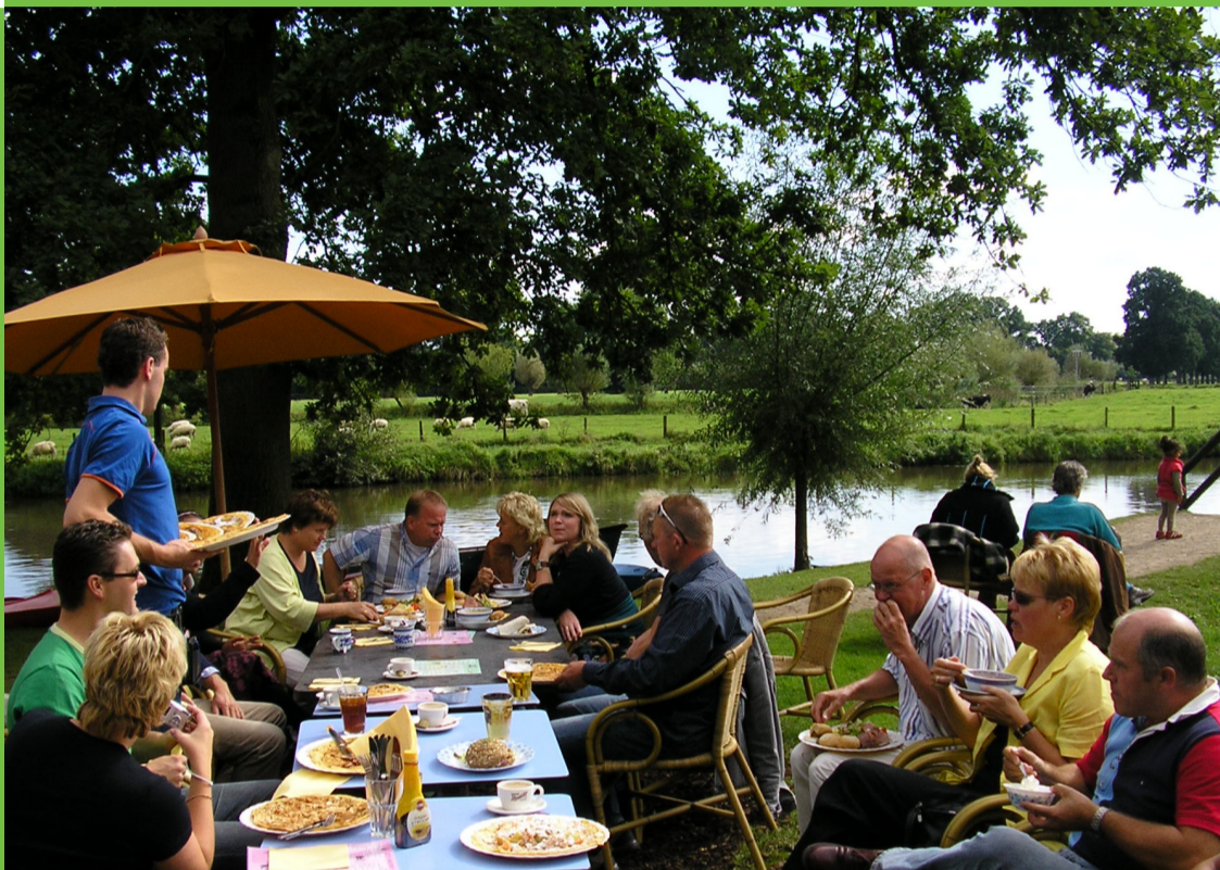
artikelcode 8379 / februari 2009

Inspiratie voor de ontwikkelings- mogelijkheden van (groene) recreatie en ontspanning