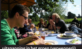
uitspanning in het groen (verwennerij)