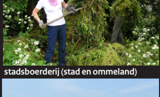
stadsboerderij (stad en ommeland)