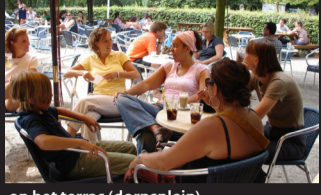
op het terras (dorpsplein)