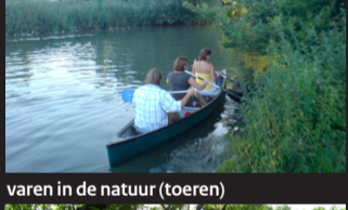
varen in de natuur (toeren)