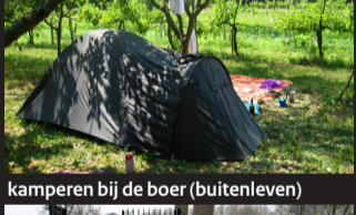
kamperen bij de boer (buitenleven)