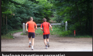
bosloop (sportieve recreatie)