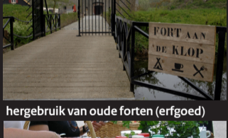
hergebruik van oude forten (erfgoed)