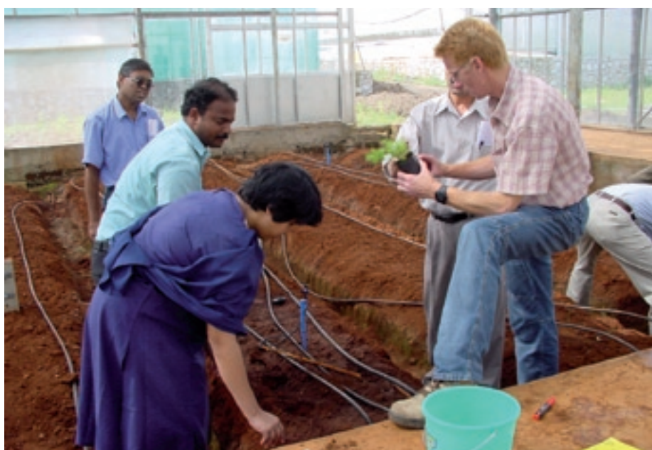
Cursisten aan het werk op het gebied van tuinbouw en sierteelt.

De standaardtrainingen variëren van star-