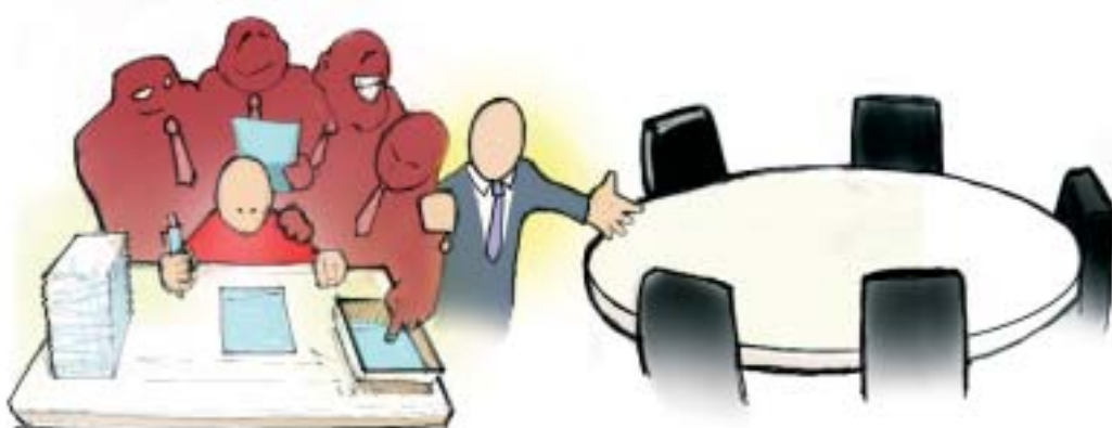
Regisseren is verleiden

“Het is maar de vraag of expliciete instrumenten (zoals een aanwijzingsbevoegdheid of meer middelen) partijen die echt niet willen of kunnen, over de streep trekken. De impliciete instrumenten van de gemeente zouden wel eens sterker kunnen blijken dan de expliciete.” 4