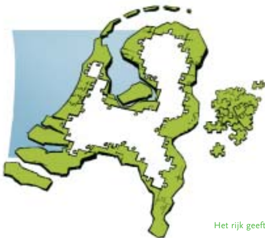
Het rijk geeft de kaders

Veiligheid, integratie en onderwijs: in toenemende mate maken gedetailleerde rijksregels op deze beleidsterreinen plaats voor een aanpak die lokale overheden de ruimte geeft om vraagstukken op te lossen en waarvoor het rijk slechts de kaders geeft. Binnen deze kaders hebben gemeenten de bewegingsvrijheid en de verantwoordelijkheid om samen met maatschappelijke instanties passende oplossingen te zoeken voor lokale problemen.