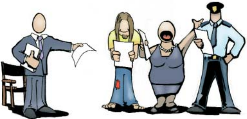
Verschillende actoren vragen om verschillende tactieken van de regisseur

In gesprekken met gemeenteambtenaren, werd nogal eens naar voor gebracht dat het onderscheid van Partners + Pröpper louter theoretisch is en in de praktijk nauwelijks van betekenis zou zijn. Daarbij past wel een nuancering. De verschillende regietypen vragen alle om een verschillende opstelling van gemeente naar haar partners. Die opstelling varieert naargelang de verschillende gradaties van doorzettingsmacht die een gemeente heeft. Op het terrein van jeugd en veiligheid bijvoorbeeld heeft een gemeente te maken met een veelheid aan partners, zoals politie, openbaar ministerie, bureau Jeugdzorg, bureau Halt, scholen, welzijnsinstellingen en ook bedrijven. Als het gaat om doorzettingsmacht, neemt een gemeente verschillende posities in naar de verschillende actoren. Zo zal een gemeente vanwege een bepaalde subsidierelatie meer doorzettingsmacht hebben naar het welzijnswerk in haar gemeente dan bijvoorbeeld naar het onderwijs of naar politie. Een gemeente moet dus voortdurend schakelen tussen de verschillende posities die zij inneemt tegenover relevante partners en haar tactiek voor de wijze waarop zij haar regierol oppakt voor iedere partij afzonderlijk bepalen. Het onderscheid in regietypen maakt dus voor een gemeente inzichtelijk wat haar bevoegdheden en speelruimte zijn naar andere partijen en welke tactiek zij kan hanteren om de medewerking van andere partijen te verkrijgen.