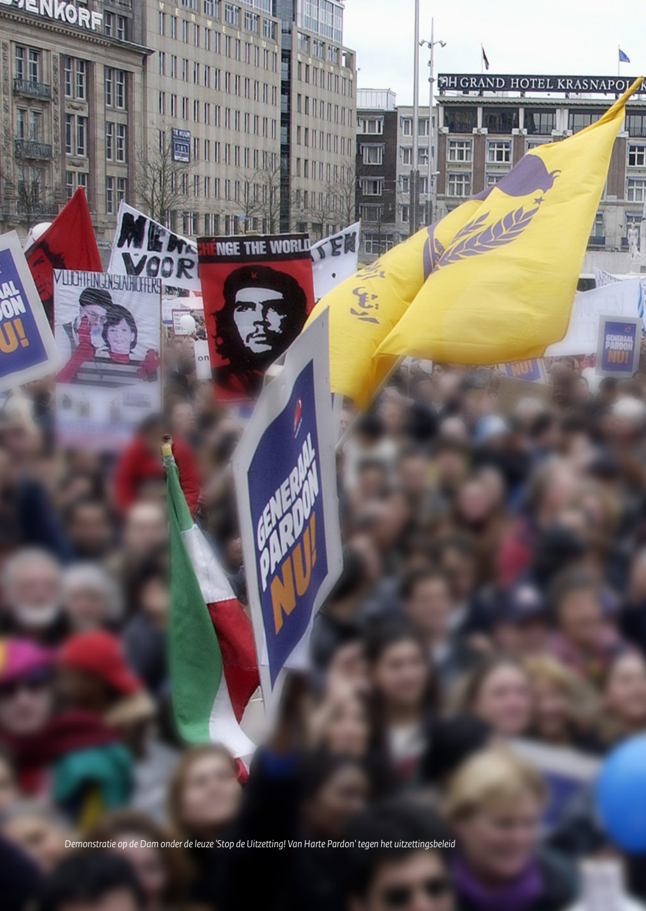
Demonstratie op de Dam onder de leuze 'Stop de Uitzetting! Van Harte Pardon' tegen het uitzettingsbeleid