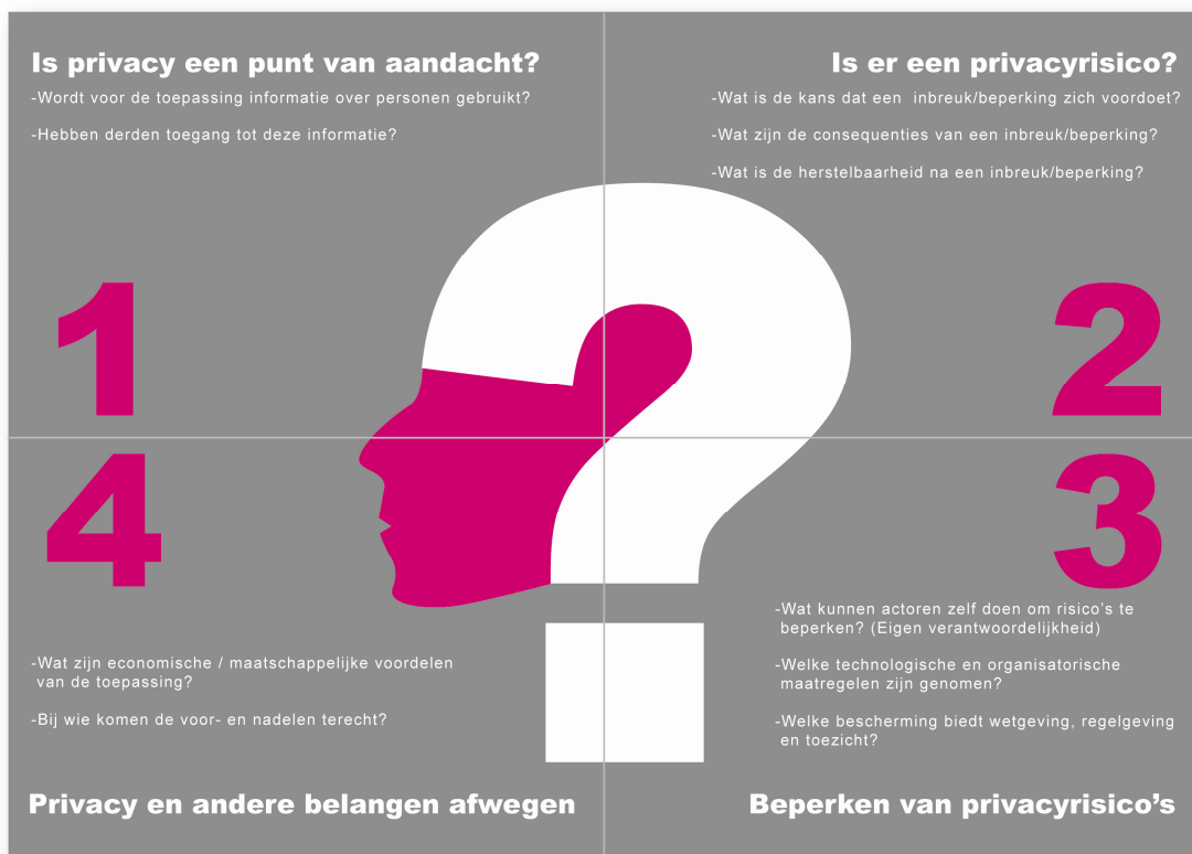
Figuur 3: Het 'privacy-vierkant', een model voor communicatie over privacy

Vanuit hun coördinerende rol op het terrein van ICT en privacy zullen de ministeries van Economische Zaken, Justitie en Binnenlandse Zaken en Koninkrijksrelaties de komende tijd nadrukkelijker aandacht vragen voor dit aspect en waar mogelijk adviseren over het aanpakken ervan.