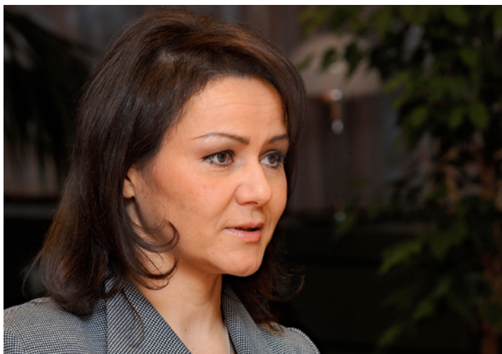
Staatssecretaris Albayrak: "Voorheen stonden er hoge schotten tussen de werelden van de gevangenis en de vrije samenleving."

"Voorheen stonden er hoge schotten tussen de werelden van de gevangenis en de vrije samenleving. Dat heeft veel ellende opgeleverd, want als mensen onvoorbereid en zonder opvang vrijkomen, is het recidiverisico groot. Die schotten hebben wij - mede dankzij de programma's Sluitende aanpak nazorg en Modernisering gevangeniswezen - voor een belangrijk deel kunnen wegnemen. Ook met andere programma's, zoals Geweld en Vernieuwing forensische zorg kunnen Veiligheidshuizen hun voordeel doen."