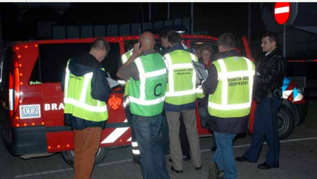
IOOV in actie bij RADAR-oefening in Utrecht

Toegespitst op de veiligheidsregio's zei oud-minister Ter Horst dat de rampenbestrijding en crisisbeheersing begin dit jaar op orde moest zijn. Vervolgens was het aan de Inspectie OOV om de regio's door te lichten.