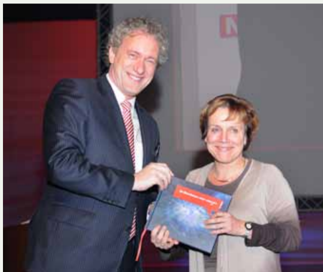
Thom de Graaf, voorzitter Veiligheidsberaad overhandigt het eerste exemplaar van het boek 'De brandweer over morgen', aan staatssecretaris Ank Bijleveld.

om voor zichzelf een nieuwe rol in de samenleving te definiëren. De Wet veiligheidsregio's biedt daarvoor volgens haar de gelegenheid.