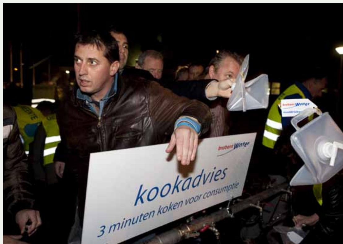
Nooddrinkwateroefening bij drinkwaterbedrijf Brabant Water.

Op woensdag 16 juni 2010 organiseert het Veiligheidsberaad in samenwerking met Vewin een expertmeeting over het project Vitale Partnerschappen. Het doel van de expertmeeting is om medewerkers van de vitale sectoren, veiligheidsregio's en politie met elkaar in contact te brengen en te informeren over de inhoud en implementatie van de convenanten. Voor meer informatie, kijk op: www.expertmeetings-veiligheidsregio.nl //