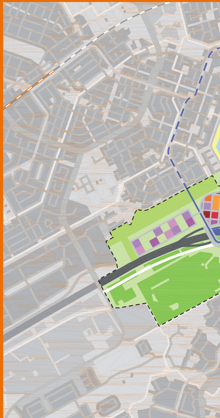
Toekomstbeeld Almere Centrum Weerwater uit Structuurvisie Almere 2.0