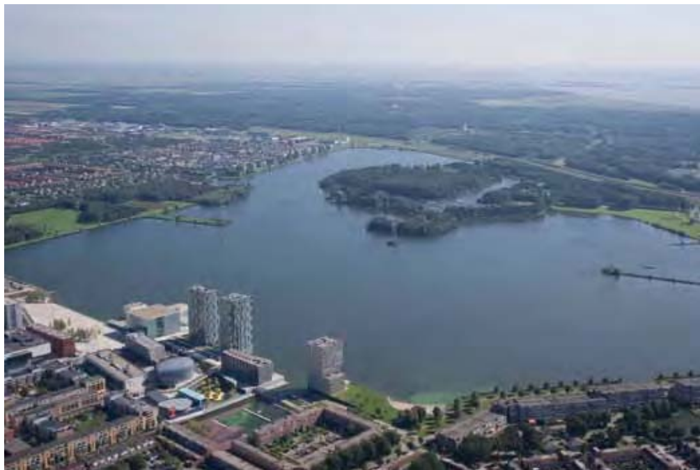
Almere Centrum Weerwater ligt aan de zuidzijde van het Weerwater (bestaand knooppunt A6 Almere Haven)

uitbreiding spoornetwerk met 12 treinen per uur tussen Almere en Amsterdam