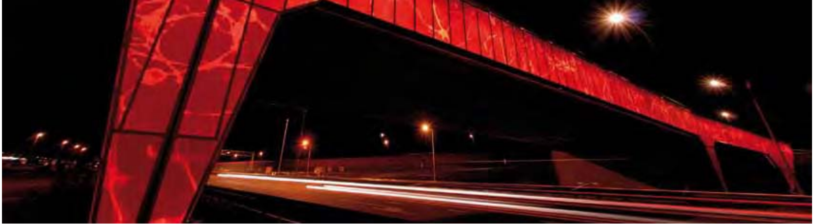
Viaduct High Tech Campus, ontwerp Har Hollands