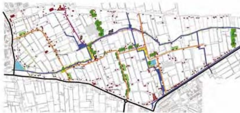
Bestanddeel nieuwe hoofdstructuur met binnenplan