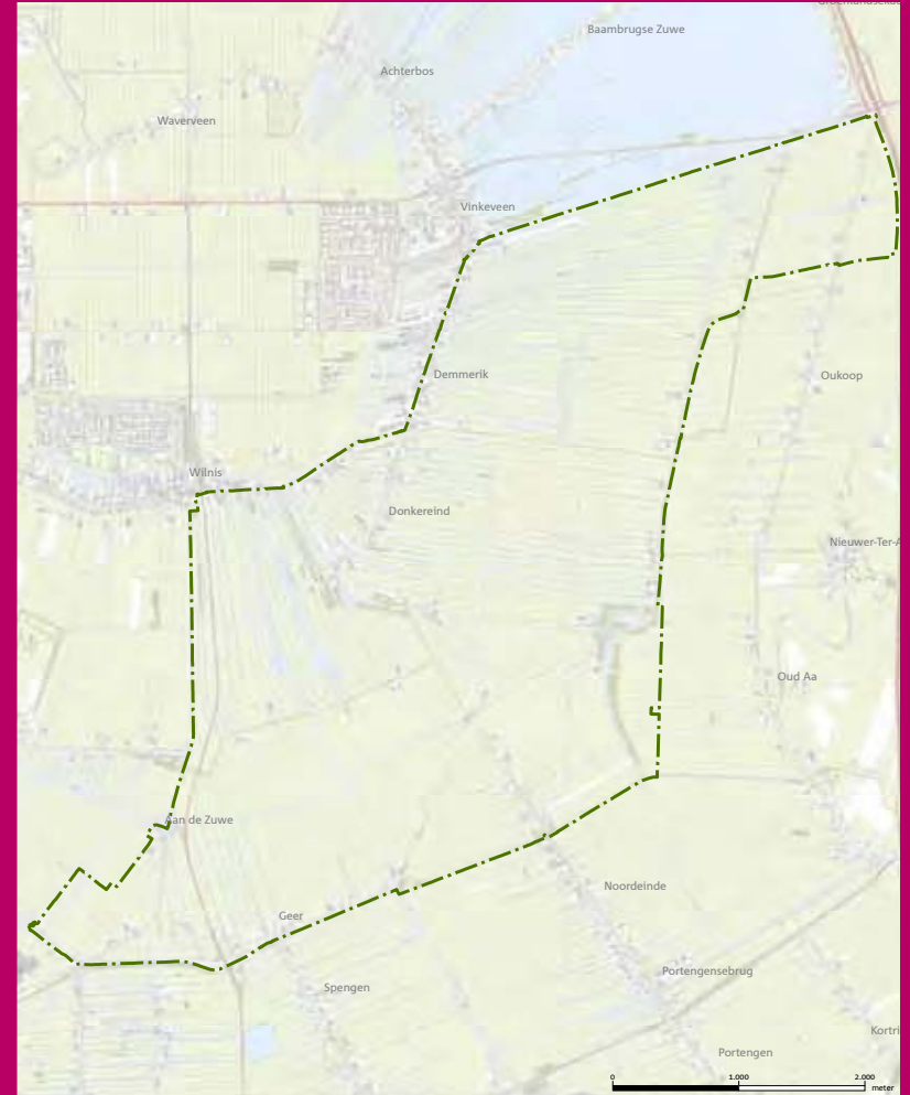
Begrenzing project Wilnis-Vinkeveen