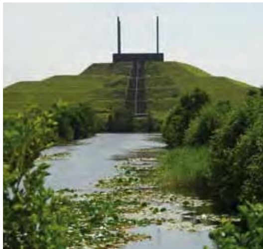
Big Spotters Hill

“De geplande woningbouw en groen- en recreatiegebieden maken straks een heel bijzonder gebied in de Randstad. Dat wordt nog eens versterkt door het geheel nieuwe en innovatieve watersysteem dat ook veel mogelijkheden biedt voor recreatie. De Westflank wordt dan door haar bijzondere karakter het gebied ‘waar de Randstad tot rust komt’. Ik ben daarom zeer verheugd dat het Rijk met deze bijdrage een flinke stap heeft gezet om onze ambities waar te maken.”