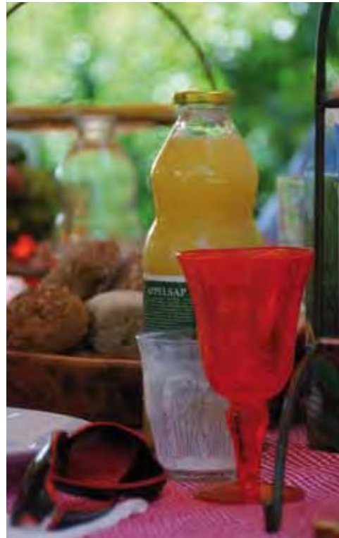
Landgoed de Olmenhorst