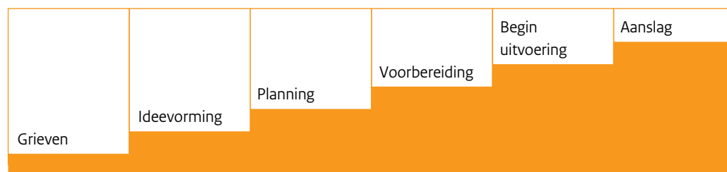
Figuur 1. 'Path to intended violence' (Calhoun & Weston, 2003; uit IPOL, 2007)

Zij komen tot de conclusie dat personen die een aanslag plegen, dus daadwerkelijk tot handelen overgaan, voorafgaand aan het geweld een aantal stadia doorlopen. Zij beschrijven de stadia van gepland naar feitelijk geweld en onderscheiden daarin zes stappen (figuur 1):