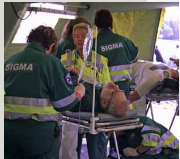
Oefenslachtoffers in simulatie ambulancehulp

Met subsidie van het ministerie van BZK is GHOR Nederland gestart met de ontwikke-