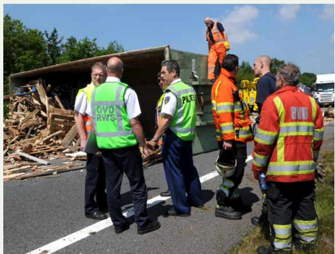
Officier van dienst Rijkswaterstaat in overleg met de hulpverleners.

Een volgende uitdaging is volgens Van der Hee het verder invullen van de rol van Rijkswaterstaat in de koude fase van de crisisbeheersing. Als grootste infrastructuurbeheerder kan Rijkswaterstaat immers ook bij risicobeheersingsvraagstukken een belangrijke inbreng leveren, met specifieke kennis en deskundigheid op het gebied van verkeer, vervoer en infrastructuur. "Effectieve samenwerking in alle schakels van de veiligheidsketen vraagt van de netwerkpartners dat zij over de grenzen van hun eigen organisatie of beleidsterrein willen kijken. In de af te sluiten samenwerkingsconvenanten met de veiligheidsregio's willen we dat voornemen bestendigen." //