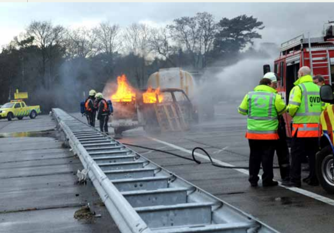
In het multidisciplinair oefencentrum in het Duitse Weeze worden officieren van dienst Rijkswaterstaat via realistische scenario's opgeleid en getraind.

der Hee vervolgt: "Voor een robuuste samenwerkingsrelatie is het noodzakelijk dat we zoveel mogelijk volgens uniforme afspraken werken. Dat schept voor alle partijen duidelijkheid en voorkomt onnodige vertraging en discussie in crisistijd."