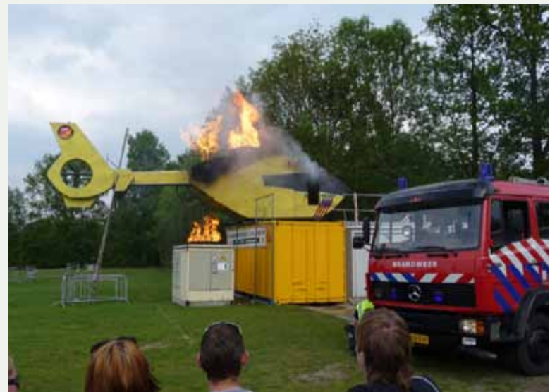
Liander: Naast bestuurlijke samenwerking wordt ook veel aandacht gegeven aan de operationele samenwerking. Tijdens de gezamenlijke oefening was er sprake van een helikopterbrand en een trafohuisje van Liander. De wederzijdse procedures werden bij de oefening getest.

De meerwaarde van een convenant ligt volgens hem in de eenduidigheid van de afspraken. Die gaan over oefeningen, opkomsttijden bij grote storingen, over verantwoordelijkheden en beschikbaarheid. Een groot deel draait volgens Nieuwland om het 'managen van verwachtingen', van besluitvorming en crisiscommunicatie tot en met de inzet van en het inzicht in noodvoorzieningen. Nieuwland: "Het is belangrijk dat je daar over en weer helder in bent. Dit voorkomt tijdens een echte crisis een hoop discussie."