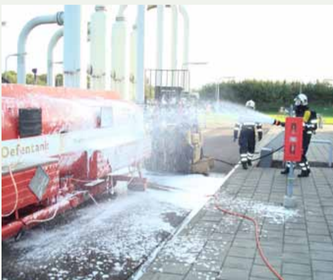
Gasunie: calamiteitenoefening Alphen aan den Rijn, 2009.