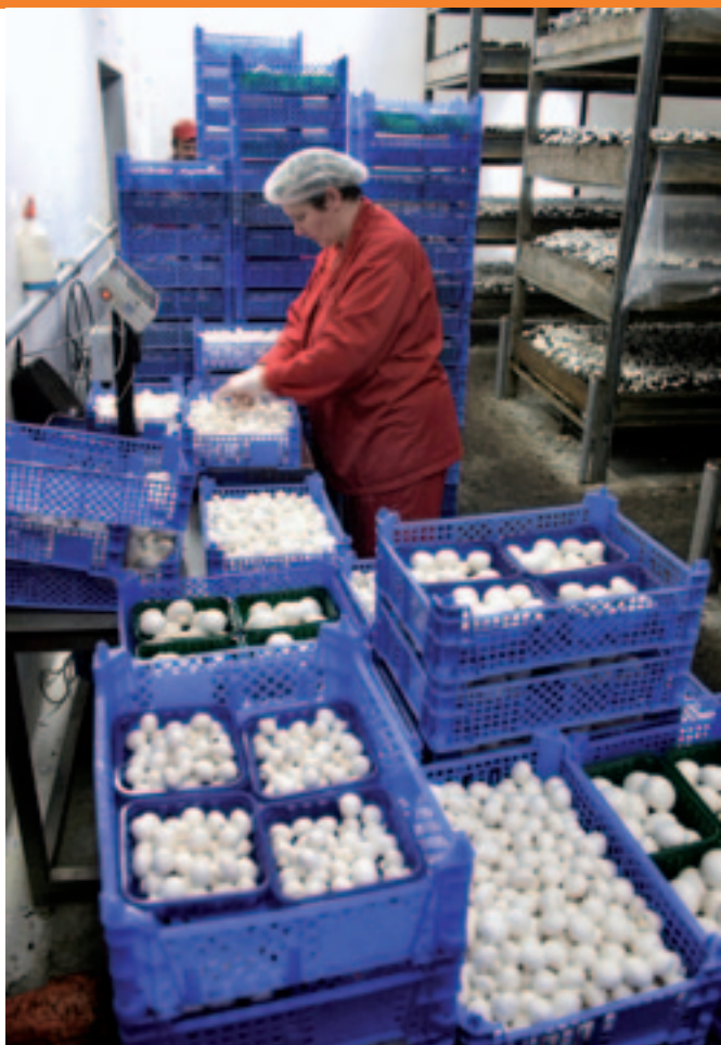
Plukster sorteert witte champignons bij Okechamp in Polen.