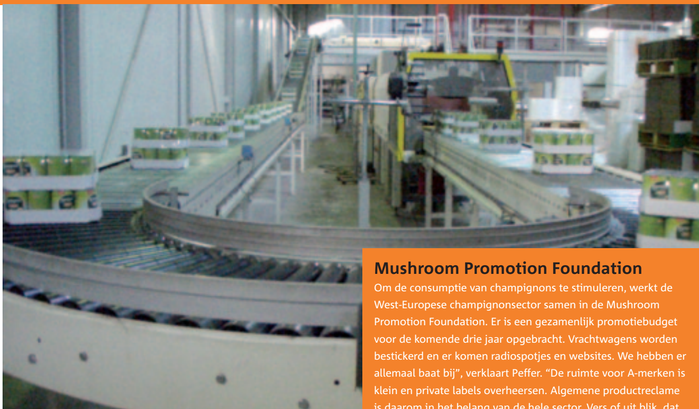
Verbeterde inpaklijn geconserveerde champignons bij ProChamp.

verhaal. Door te investeren in veiligheid en het milieu is de beheersbaarheid van onze processen aanzienlijk verbeterd." Het bedrijf maakt haar compost bijvoorbeeld in volledig afgesloten ruimtes. Vliegjes en ziektekiemen komen er niet in. Geuren en ammoniak worden uitgewassen. Door de goede hygiëne vanaf het begin zijn er ook bij de kweek geen gewasbeschermingsmiddelen meer nodig. Nederland loopt hier ook binnen Europa in voorop.