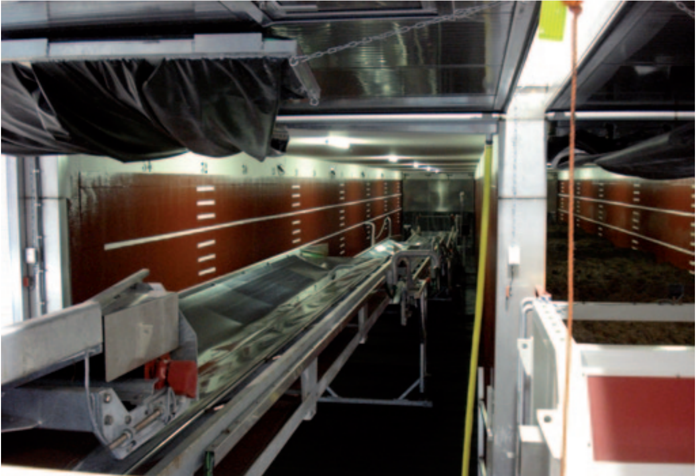
Automatisering van de productie van grondstoffen beperkt de kosten en draagt bij tot een concurrerende champignonteelt.

is idealer voor de productie van compost in tunnels en voor de teelt van champignons. Je hebt daarbij absolute beheersing over de temperatuur nodig en met ons vriendelijke klimaat is dat eenvoudiger en voordeliger te realiseren. Wij kunnen de temperatuur snel en precies regelen en misoogsten voorkomen. In het oosten wordt de fase één compost nog wel buiten geproduceerd. De enorme buitentemperatuurwisseling daar doet afbreuk aan de kwaliteit, die vervolgens in het gehele proces doorwerkt. En een champignon is een kwetsbaar vruchtje dat al snel kwalitatief wordt aangetast. Natuurlijk werkt men ook daar aan verbetering van de technieken en komt daarbij Nederlandse kundigheid van pas. Maar om te zeggen dat het exporteren van techniek in onze branche substantieel iets oplevert, nee. Het blijft marginaal.”