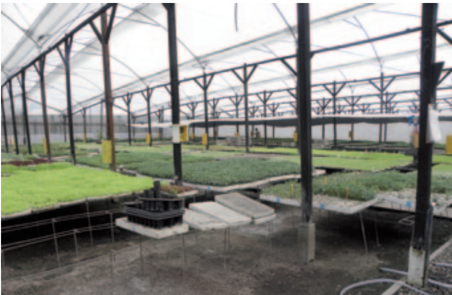
Een overzicht van de enorme variëteit aan jonge groenteplantjes, die er gekweekt worden.

De grotere en georganiseerde groente- en fruitexporteurs van Guatemala stellen zich strategisch op en zijn bereid met Europese partners samen te werken om gezamenlijk de markt in Europa en de Verenigde Staten van groente te voorzien. Samenwerken in die zin, dat men de productie van 'Europese' groenten in Guatemala wil opzetten voor de