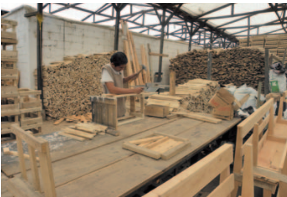
De kistenmaker kom je in Nederland niet meer tegen, maar in Guatemala wel.