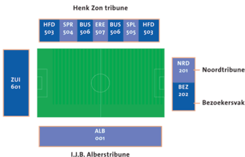
Figuur 2.1 Plattegrond Stadion Woudestein