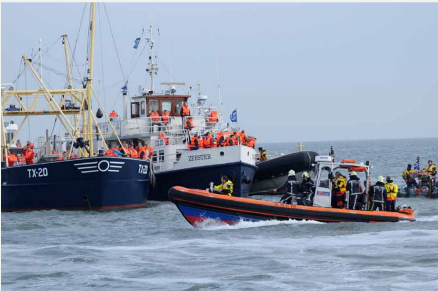
Effectieve hulpverlening te water in Noord-Holland Noord.