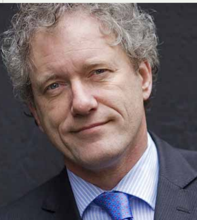
De Graaf: "Veiligheidsregio's te belangrijk om slachtoffer te worden van politieke discussie."