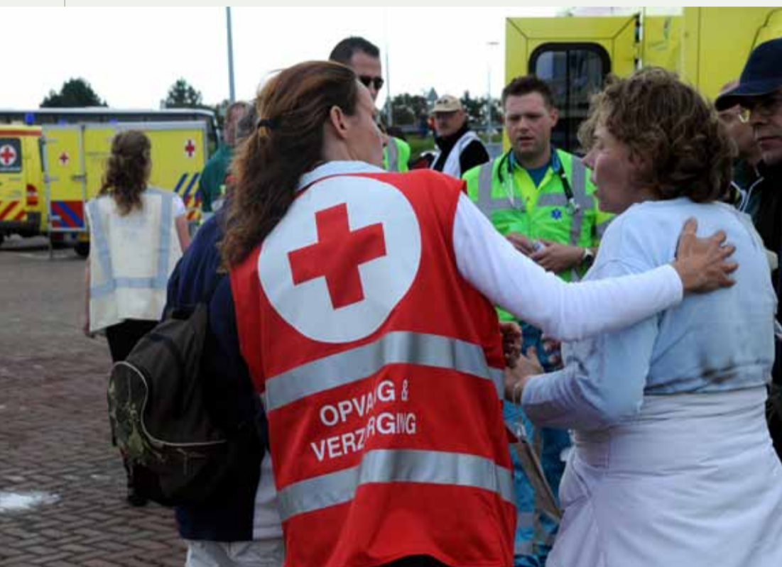
Medewerkster SIGMA-team leidt lichtgewonde vrouw naar EHBO-post.

Nico Zuurmond: "We stemmen onze verenigingsstructuur af op de indeling van de veiligheidsregio's. Zij zijn de nieuwe spil in de rampenbestrijding."