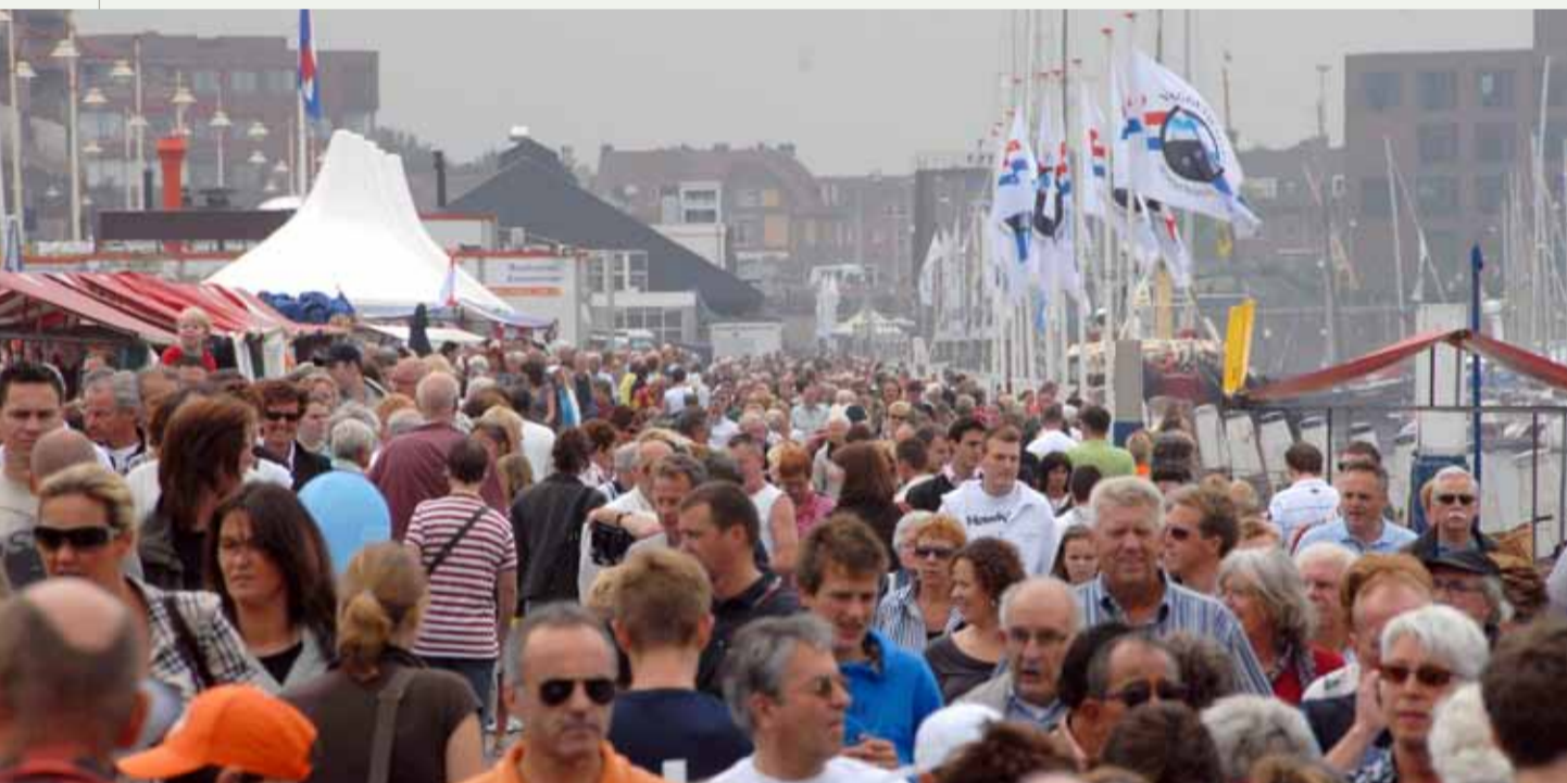
Een drukbezochte Vlaggetjesdag in Scheveningen.

dan een danceparty met 200 mensen. Gelet op de doelstellingen van de Wet veiligheidsregio's sluit ik niet uit dat vergunningen van evenementen met een regionale uitstraling straks gaan vallen onder de bevoegdheid van het Veiligheidsbestuur. Immers meerdere evenementen op één dag hebben consequenties voor de gehele regio, vanwege de capaciteitsvraag richting de hulpverleningsdiensten."