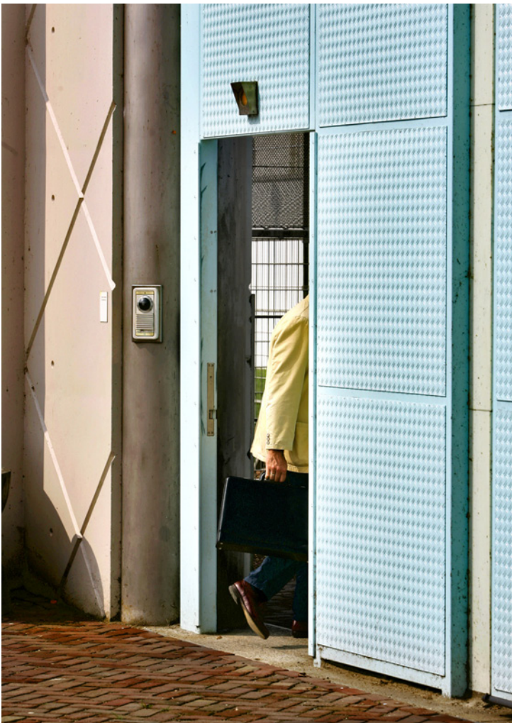
De reclassering komt de tbs-kliniek binnen om de uitstroom van de tbs-gestelde te helpen voorbereiden; de deskundigen van de kliniek blijven betrokken als de tbs'er naar buiten gaat.

De afgelopen twee jaar verkeerde het forensisch psychiatrisch toezicht (fpt) in een testfase. Fpt is een vernieuwde vorm van toezicht op tbs-gestelden die zich voorbereiden op terugkeer in de maatschappij. Uit onderzoeken van het WODC en de Inspectie voor de Sanctietoepassing blijkt dat het goed werkt. Begin 2011 wordt fpt landelijk ingevoerd.