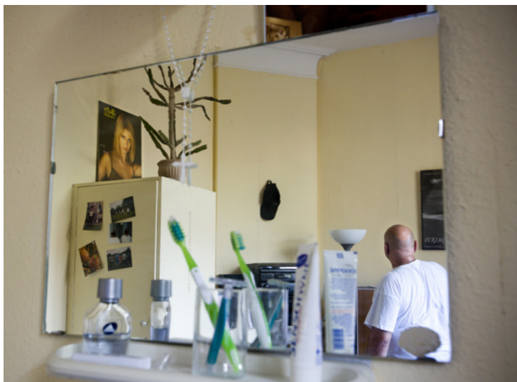
Volgens de nieuwe criteria moeten bewoners in staat zijn binnen 18 maanden uit te stromen.

Het ministerie van Veiligheid en Justitie zet nieuwe lijnen uit voor de subsidiëring van 24 uren nazorg aan (ex-)justitiabelen, zoals die sinds een aantal jaren wordt uitgevoerd door de instellingen Ontmoeting, Moria, Exodus en Door.