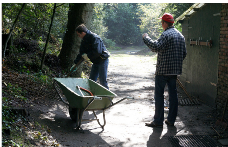
In de eerste fase van hun verblijf zijn de bewoners hoofdzakelijk actief op het terrein, bijvoorbeeld bij de groenvoorziening of in de timmerwerkplaats.