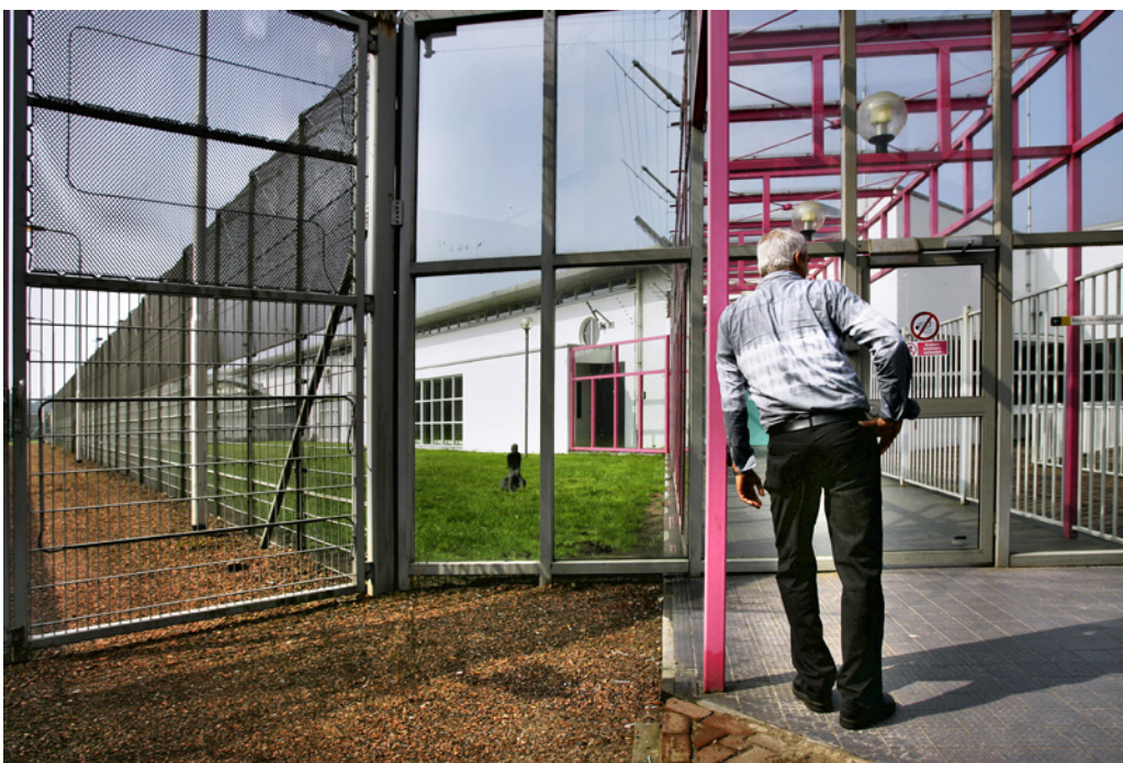
Gedetineerden die na hun vrijlating een normaal bestaan willen opbouwen, ontbreekt het vaak aan de daarvoor noodzakelijke sociale vaardigheden

Nieuw basispakket terugkeeractiviteiten gedetineerden