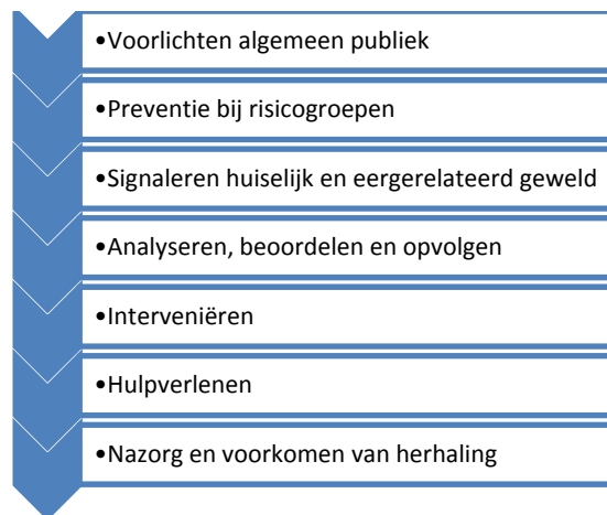
Figuur 4.1 Lokale ketenaanpak huiselijk en eengerelateerd geweld

Voor de stappen 3 tot en met 7 van deze keten (van signalering tot en met nazorg) bestaat op lokaal niveau een structuur waarin de relevante partijen elk een plaats hebben. Deze structuur is weergegeven in figuur 4.2. In deze figuur is te zien op welke manier signalen van huiselijk geweld bij de politie, AMK of de steunpunten terecht komen en naar wie ze worden doorverwezen. Signalen kunnen op twee manieren worden gemeld. De 'vindplaatsorganisaties' kunnen signalen rechtstreeks melden aan de genoemde partijen of via de casus-overleggen waaraan ze deelnemen, zoals de zorgadviesteam, het veiligheidshuis of het casusoverleg van het Centrum voor Jeugd en Gezin.