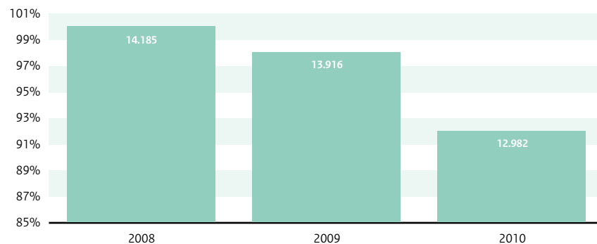
Niet operationele sterkte Nederlandse Politie

Onderzoek (KPMG 2009) heeft aangetoond dat landelijke aansturing en bundeling van taken en mensen structurele besparingen op het beheer van de regionale politie oplevert, oplopend tot € 259 miljoen. Aansluitend op dit onderzoek zijn, op advies van KPMG en onder regie van het dagelijks bestuur van het Korpsbeheerdersberaad, businesscases uitgevoerd op de onderwerpen ICT, inkoop, integratie van interne en externe managementinformatie (ERP), Personeel en Financiën. De Business cases tonen elk afzonderlijk aan dat landelijke bundeling van bedrijfsvoeringstaken in een Politiedienstencentrum (PDC) en standaardisatie van resterende korpstaken de geraamde structurele besparingen opleveren of zelfs overtreffen. Deze besparingen liggen dus vooral op het terrein van de niet operationele sterkte. De realisatie van de businesscases wordt gezien als een haalbaar maar ingrijpend traject.