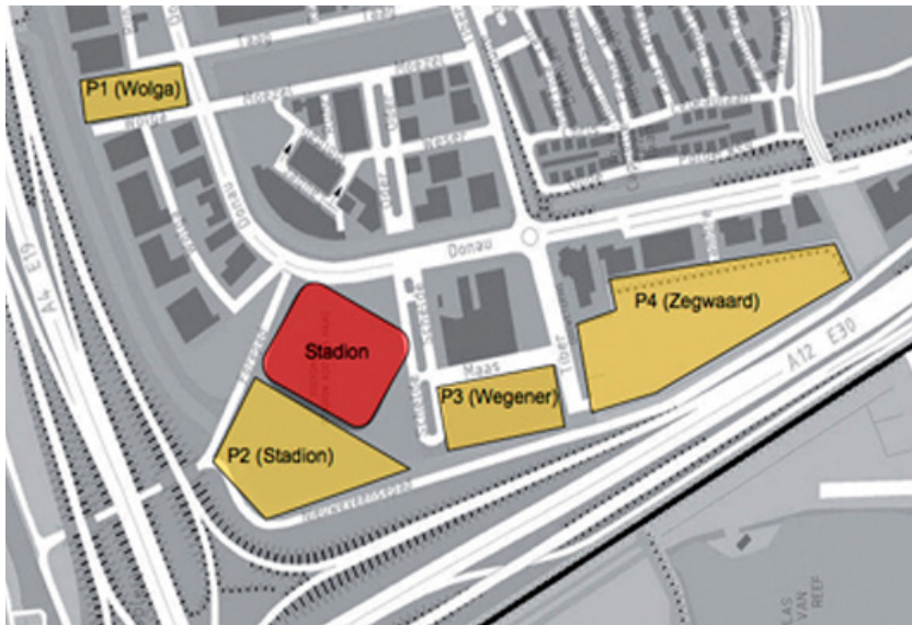
Figuur 3: parkeerlocaties 1