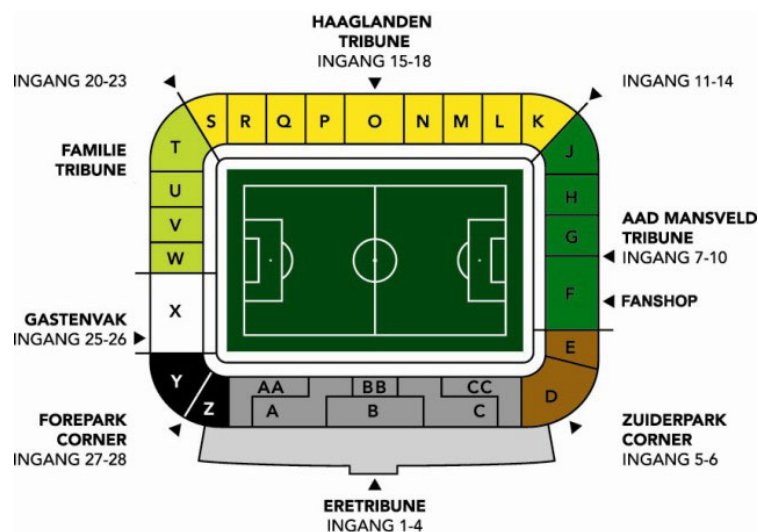
Figuur 2: stadion indeling

Een sector telt 5000-6500 plaatsen (lange zijde) of 2000 plaatsen (korte zijde). Er zijn diverse horecavoorzieningen aanwezig waar men eten en drinken kan kopen, waaronder vier tappunten. In het stadion is een fan-shop aanwezig. Buiten het stadion is een Multi Functioneel Centrum (MFC), c.q. supportershome. De algehele staat van het stadion is goed te noemen.