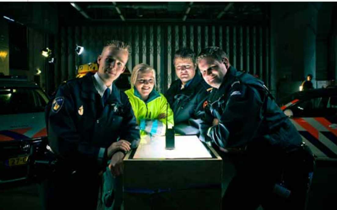
De hoofdrolspelers in de campagne 'Portogewoon'.

Eind januari is de website www.portogewoon.nl online.