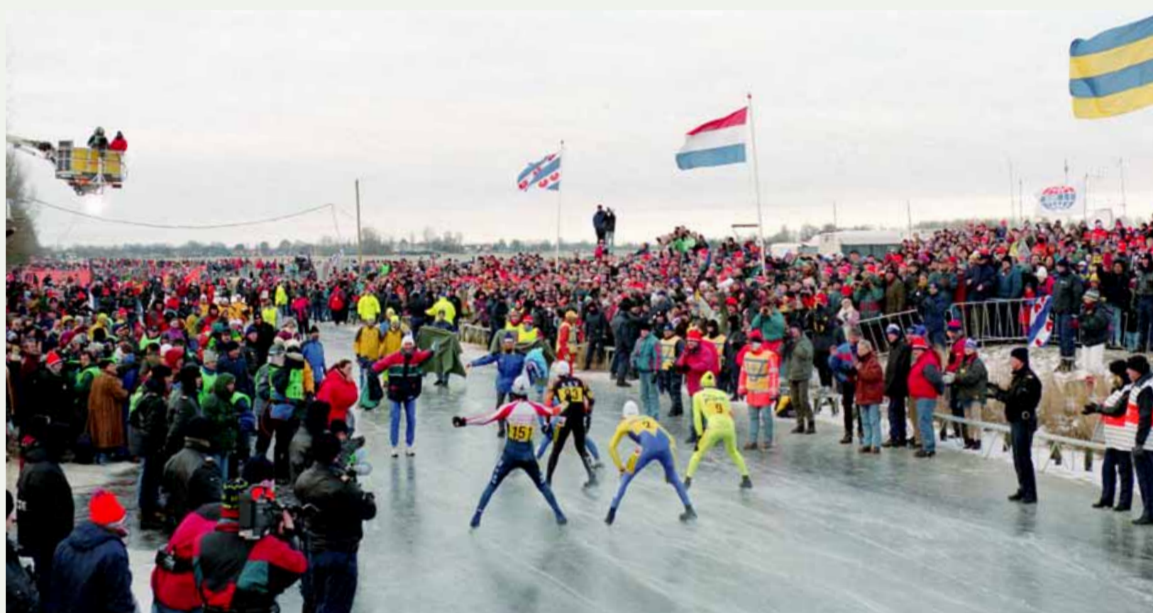
Elfstedentocht: De 'Tocht der tochten' in 1997. De draaiboeken voor komende winter liggen al klaar.