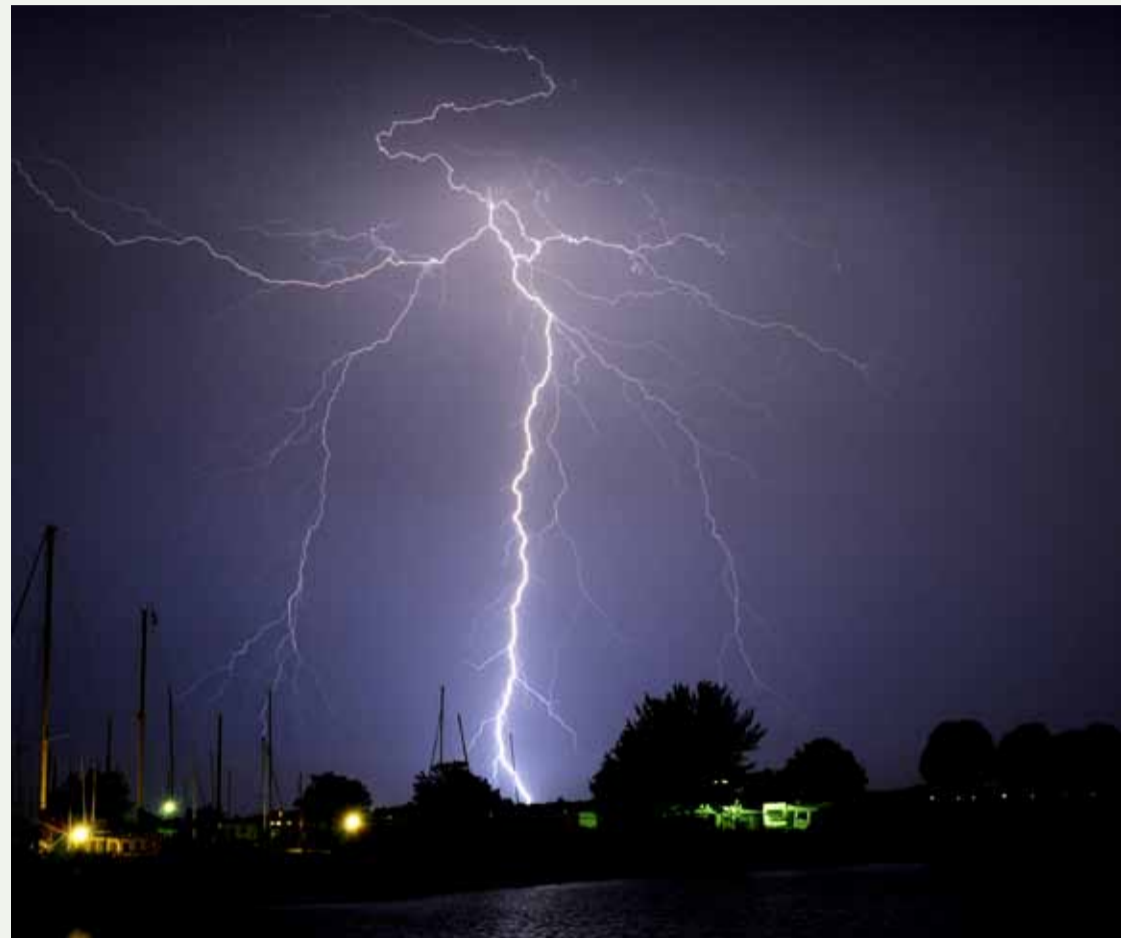
Met het geregionaliseerde weeralarm kan gericht voor extreem weer worden gewaarschuwd.

Kroonenberg: "Het KNMI is een schakel in het Beleids Ondersteunend Team milieu-incidenten, een netwerk van specialistische kennisinstellingen onder verantwoordelijkheid van het Ministerie van I&M. Regio's kunnen voor eenduidige advisering het BOT-mi als samenwerkingsverband inschakelen, waarin wij dan ons weerkundig deeladvies inbrengen. Tegelijk blijven we altijd rechtstreeks benaderbaar voor de brandweer. Daar ligt de verantwoordelijkheid voor de bronbestrijding. Met name de specialisten op