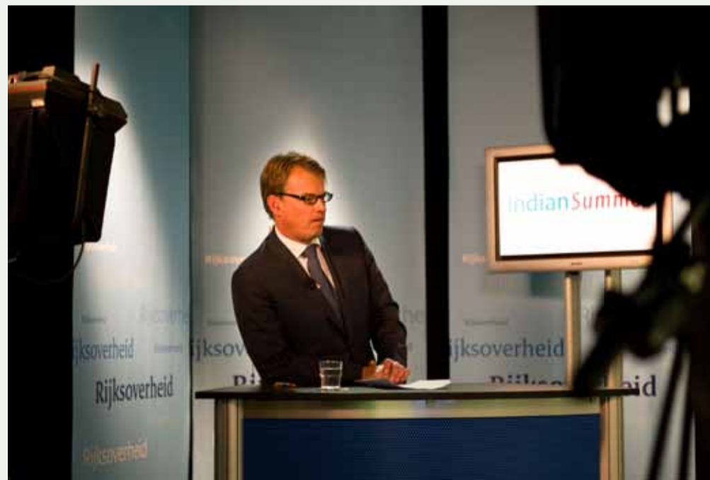
Presentator Indian Summerjournaal.

andere organisaties en partijen betrokken bij de Nationale Staf oefening Nuclear.