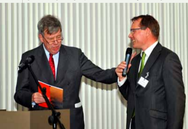
Minister Opstelten ontvangt uit handen van kwartiermaker Alexander Heijnen het werkprogramma natuurbrandbestrijding, tijdens de conferentie in Otterlo op 10 november.

Nederland is de afgelopen jaren getroffen door verschillende grote natuurbranden. De branden voeden het urgentiegevoel bij publieke en private partijen dat een samenhangende aanpak voor