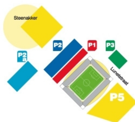
Figuur 3.2: Parkeerplaatsen rond het stadion van NAC Breda

Er ligt een fietsenstalling aan de zuidkant van het stadion. Er komen naar schatting per wedstrijd ongeveer 3.000 supporters op de fiets naar het stadion. Het stadion is per bus goed bereikbaar, onder meer in tien minuten vanaf Breda CS. De website van NAC Breda moedigt supporters aan om te carpoolen. Om de parkeerdruk op de omgeving van het stadion te verminderen, is geprobeerd om een speciale buspendeldienst op te zetten. Dit had een beperkt effect en is daarom in mei 2011 stopgezet. De huidige parkeerdruk leidt ertoe dat supporters mede parkeren in nabijgelegen wijken.