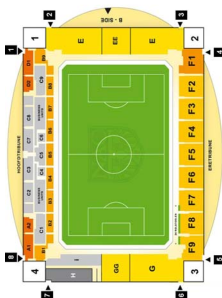
Figuur 3.1: Plattegrond van het stadion