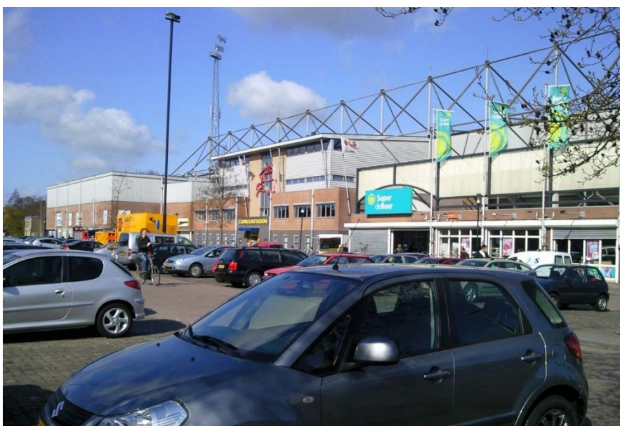
Figuur 1: Aanzicht Cambuurstadion