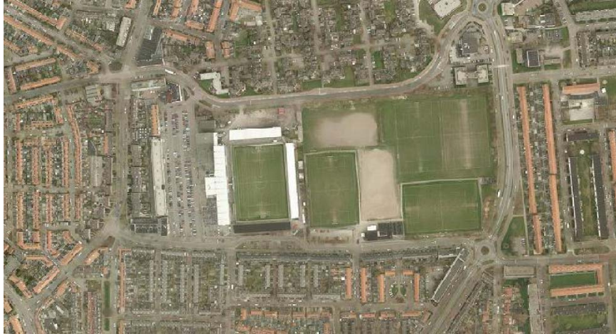
Figuur 2: ligging Cambuurstadion

Aan de noordzijde, pal naast het stadion, bevindt zich een klein parkeerterrein voor speciale kaarthouders en daarnaast een parkeerterrein voor de supportersbussen van de bezoekende clubs. Wanneer een bezoekende club echter met meer dan 3 bussen komt (circa 150 supporters), dan moet de Coopmansstraat in zijn geheel worden afgesloten om voldoende parkeergelegenheid te creëren.