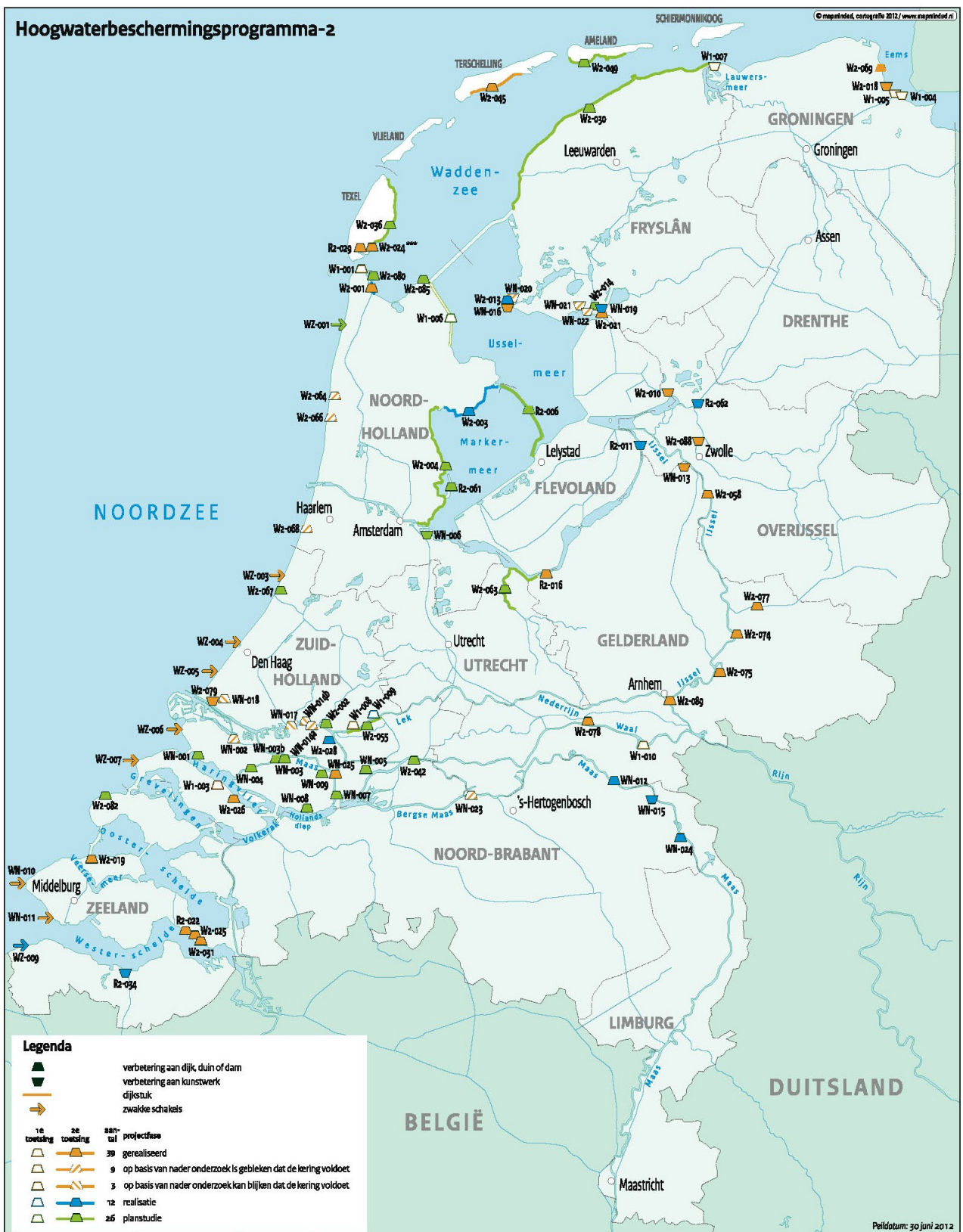
Actuele scope van het programma, peildatum 30 juni 2012.