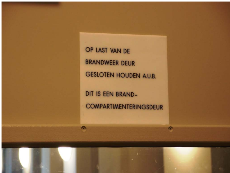
Waarschuwing op een brandwerende deur.