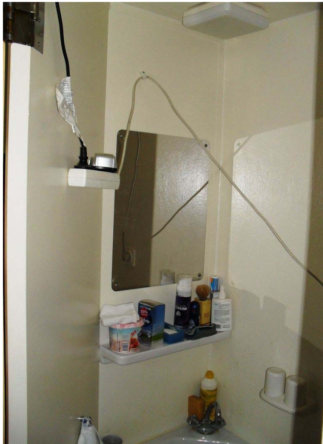
Losse verlengsnoeren met een stekkerdoos boven de wastafel in een cel.