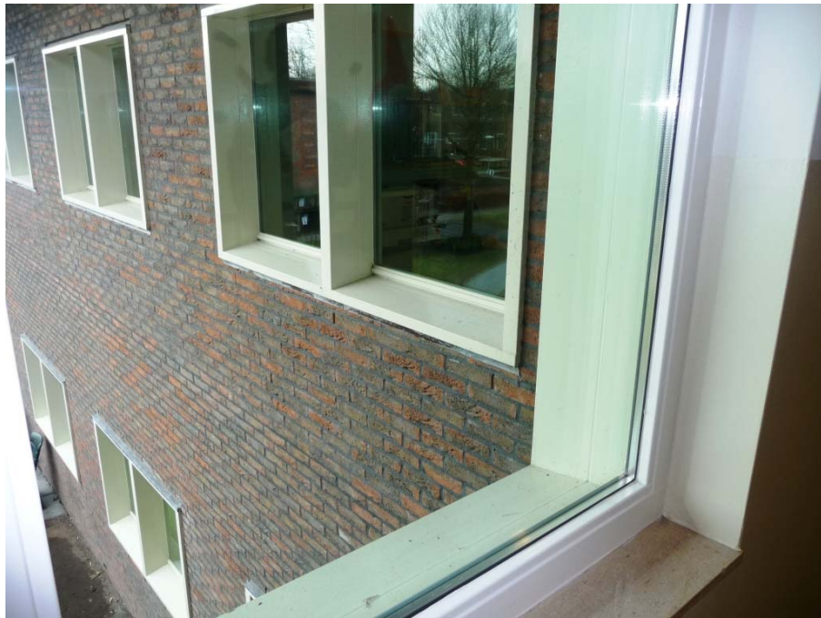
Risico van brandoverslag via ramen zonder brandwerend glas.

In deze bijlage zijn door de inspecteurs gemaakte foto's opgenomen van enkele bij het locatieonderzoek aangetroffen situaties.