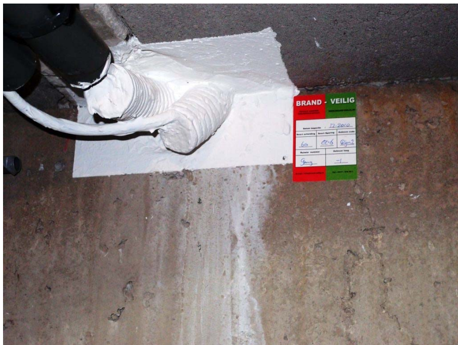
Goed afgewerkte doorvoeringen door een brandwerende scheiding.