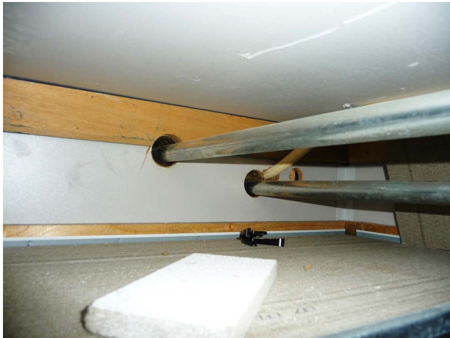
Niet afgewerkte doorvoeringen door een brandwerende scheiding.