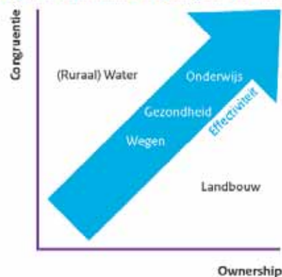
Figuur 1: Effectiviteit van begrotingssteun in Zambia

Uit de evaluatie blijkt dat begrotingssteun effectief kan zijn mits (a) de ontvangende overheid voldoende eigenaarschap toont en (b) er voldoende overeenstemming bestaat over prioriteiten en strategie voor de aanpak van knelpunten (zie Figuur 1).