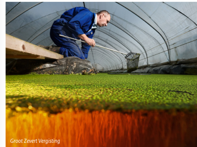
Groot Zevert Vergisting

Protix Biosystems heeft een prototype ontwikkeld van een productieproces waarmee 250 ton insecten per jaar geproduceerd kunnen worden. Insecten zijn eiwitrijk en vormen in potentie interessant visvoer. Protix heeft diverse testen uitgevoerd bij grotere visvoer producenten, met positieve resultaten.