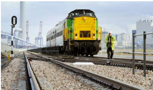
Foto: Ingebruikname Spoor (oktober 2012)