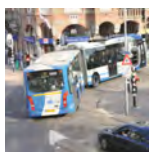
Thema Multimodale stedelijke bereikbaarheid