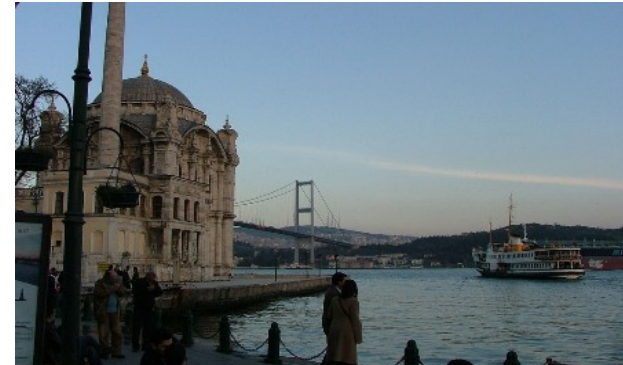
De Ortaköy moskee en de Bosporusbrug

Turkije is sterk geurbaniseerd: zo'n 70% woont in stedelijke gebieden.. In 1950 reikte Istanbul niet verder dan de Byzantijnse stadsmuren, tegenwoordig is dat nauwelijks voorstelbaar met haar ruim 12 miljoen inwoners. Dagelijks arriveren honderden mensen uit Anatolië om zich in een van de vele buitenwijken te vestigen. De metropolen in West-Turkije groeiden eveneens, terwijl het inwonertal in steden als Konya en Kayseri en in het zuiden Adana, Gaziantep en Diyarbakır zich in de afgelopen vijftien tot twintig jaar bijna verdubbelde. De verstedelijking heeft de bestaande kloof tussen het leven op het vaak afgelegen platteland en in de grote steden verdiept. Terwijl het leven in de stad mede onder invloed van de toenemende welvaart moderniseert, blijven rurale gebieden daarbij achter.