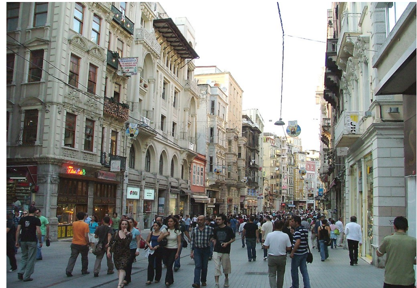
De Istiklalstraat in Istanbul

Naast economie is ook veiligheid altijd een belangrijk element geweest in de onderlinge relatie. Zo werd er in de eerste helft van de zeventiende eeuw en de tweede helft van de twintigste samengewerkt om de hegemonie van een Europese grootmacht te voorkomen: eerst tegen Spanje en de Habsburgers, later tegen de Sovjet-Unie. Vanaf de jaren vijftig is er samenwerking in NAVO-verband. Sinds 1999 is Turkije kandidaat-lidstaat van de Europese Unie. De toetredingsonderhandelingen met Turkije zijn in 2005 gestart.