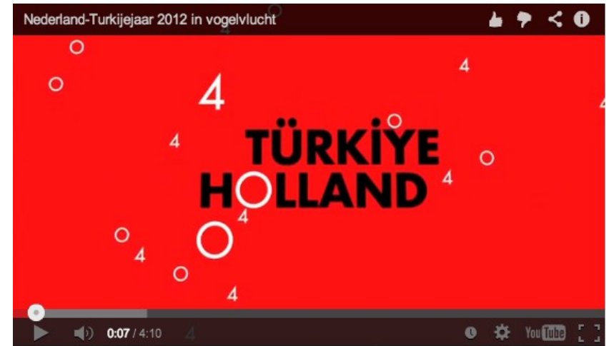
NLTR400 Filmverslag (4:10 min)