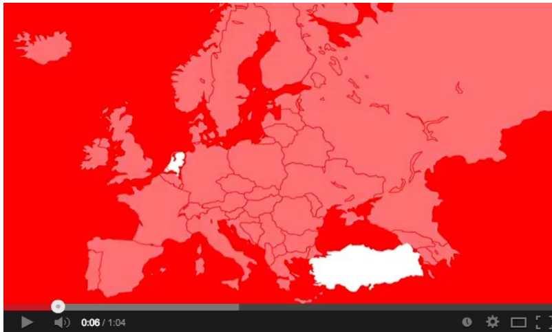
NLTR400 Promotiefilmpje (1:04 min)