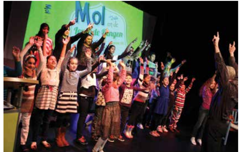
Het boek Mol en de levende dingen van de Turkse schrijfster Sevim Ak werd in het Nederlands vertaald en in de Kinderboekenweek gepresenteerd, Den Haag, september 2012 Turkish writer Sevim Ak's book was translated into Dutch and presented during Children's Book Week, The Hague, September 2012

Many Dutch and Turkish municipalities have close ties, often due to the ties to Turkey of a local Turkish-Dutch community. For the city of Haarlem, 2012 provided an occasion to strengthen its ties with its sister city Emirdağ. Deventer focused its activities on Diyarbakir in southeast Turkey, and Nijmegen reinforced its links with Gaziantep.