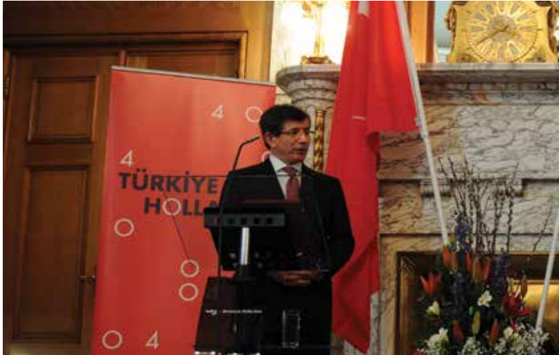
Minister van Buitenlandse Zaken Rosenthal en zijn collega Davutoğlu, tijdens de Wittenburg Conferentie, Rotterdam, maart 2012