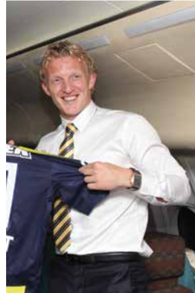
Premier Rutte met voetballer Dirk Kuyt (Fenerbahce) onderweg naar Turkije met economische missie, november 2012 Prime Minister Rutte with football player Dirk Kuyt of Fenerbahce on the way to Turkey with a trade mission, November 2012

The aim of the anniversary was not just to commemorate a historic relationship. The Netherlands and Turkey also wanted to look ahead, and they took major steps to deepen and strengthen their bilateral diplomatic, economic, cultural and social ties. There was scope, too, for dialogue because the Netherlands and Turkey do not think alike on all subjects.