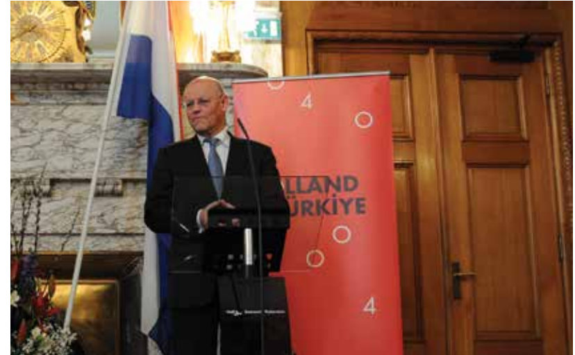
Foreign minister Rosenthal and his Turkish counterpart Davutoğlu at the Wittenburg Conference, Rotterdam, March 2012

Nederlanders van Turkse herkomst zijn in het verkeer tussen beide landen steeds vaker een waardevolle schakel, bijvoorbeeld in het bedrijfsleven. Ook in de culturele sector hebben Turkse Nederlanders vaak een brugfunctie. Dit droeg er zeker toe bij dat de Nederlandse culturele sector zich al voor 2012 op Turkije oriënteerde.