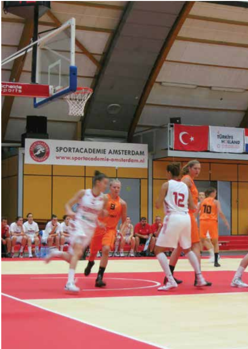
Basketball Unites Nederland-Turkije, Amsterdam, juli 2012 Basketball Unites the Netherlands and Turkey, Amsterdam, July 2012