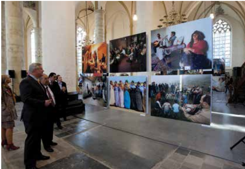
De fototentoonstelling Ebru in Deventer had de diversiteit in Turkije als thema, Deventer, april 2012 Photo exhibition Ebru on diversity in Turkey, Deventer, April 2012