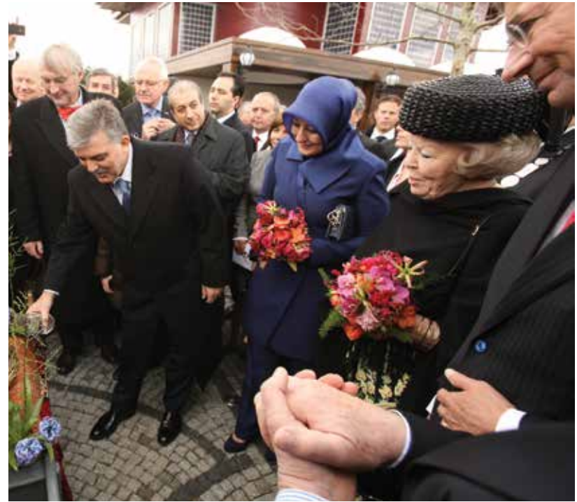
H.M. de Koningin, President Gül en Mevrouw Gül op de Floriade, Venlo, april 2012 Her Majesty the Queen and President and Mrs Gül at the Floriade, Venlo, April 2012

attended by Prince Willem-Alexander, Princess Máxima and President Gül, opened doors that might otherwise have remained closed. Dutch culture organisations had a strong presence in Turkey in 2012, for instance with exhibitions by the Amsterdam Museum and the Van Abbe Museum, and performances by the Nederlands Dans Theater. At the same time, a varied programme of Turkish dance, art exhibitions, culinary events, film festivals and concerts could be enjoyed in the Netherlands, financed from a fund set up by the Turkish authorities in 2011 especially for this purpose.