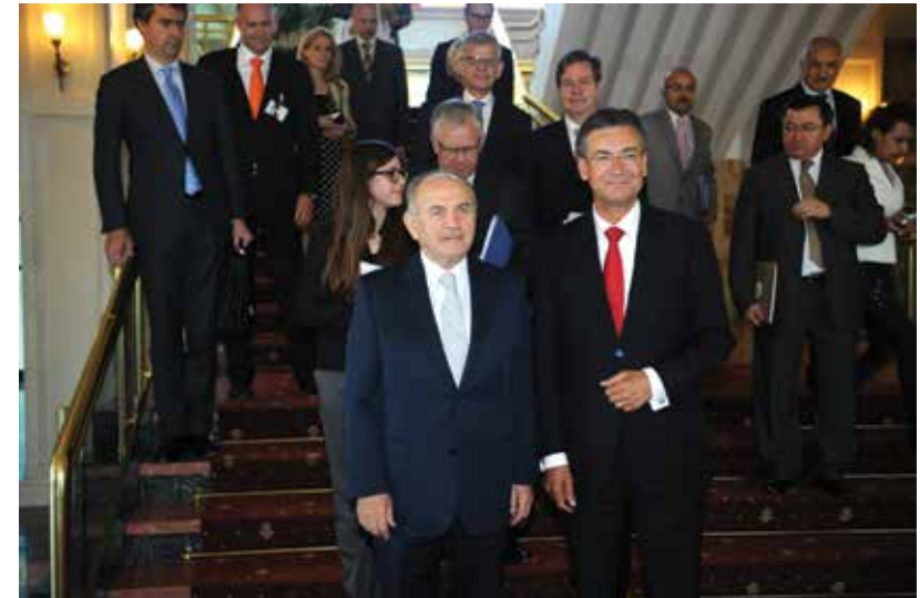
Minister Verhagen met deelnemers aan de economische missie, Istanbul, mei 2012 Economic affairs minister Verhagen with participants in the trade mission, Istanbul, May 2012

'Mission has paved the way for more work'