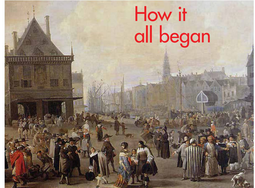
Dam Square with the New Town Hall under Construction, Johannes Lingelbach (1622-1974)