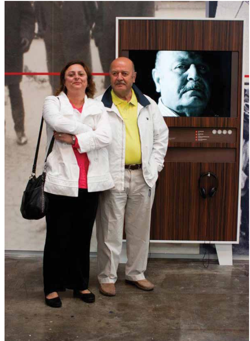
De tentoonstelling Turkse Pioniers in Amsterdam op het NDSM terrein in Amsterdam-Noord, juni 2012 The exhibition Turkish Pioneers in Amsterdam at NDSM Shipyard in North Amsterdam, June 2012

van private en publieke organisaties waarin alle handelsbevorderende organisaties hun kennis en activiteiten bundelen) het overleg over 2012 op stoom. Dit leverde een goed samenhangend programma van seminars, werkgroepen, CEO-meetings en enkele grote handelsmissies op. Ook bij gemeenten en hun achterban ontstond steeds meer belangstelling voor 2012. Dit gold zeker voor Turks-Nederlandse organisaties en de grotere culturele instellingen. De meest betrokken ministeries en de gemeenten Amsterdam, Rotterdam, Den Haag en Utrecht traden regelmatig met elkaar in overleg. Al snel sloten steden als Deventer, Schiedam en Haarlem – met een grote Turks-Nederlandse bevolkingsgroep – zich aan.