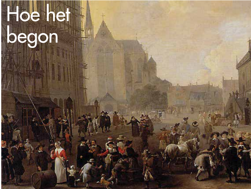
De Dam, gezien naar het Noorden met het Stadhuis in aanbouw, Johannes Lingelbach (1622-1674)

De relatie tussen Turkije en Nederland voert terug naar 1612. Toen arriveerde Cornelis Haga in Constantinopel nadat hij was benoemd tot gezant van de Republiek der Verenigde Nederlanden in het Ottomaanse Rijk. Dit was het begin van de diplomatieke betrekkingen tussen Nederland en Turkije. In de loop der eeuwen werd de band steeds gevarieerder en hechter. Begon het ooit met diplomatie en handel, tegenwoordig werken beide landen ook volop samen als het gaat om cultuur, migratie, toerisme en onderwijs. 2012 was een historische mijlpaal: de betrekkingen tussen Nederland en Turkije bestonden toen 400 jaar. Voor Nederland was dit een goede aanleiding om de relaties te verdiepen en uit te bouwen. Ook Turkije wilde 2012 benutten om de betrekkingen met Nederland op verschillende terreinen te intensiveren. De rijke geschiedenis en de nieuwe dynamiek tussen beide landen zorgden voor een grote reikwijdte van de viering. Bijna alle sectoren uit de samenleving droegen eraan bij. De viering van 400 jaar diplomatieke betrekkingen, zo zou blijken, kende in beide landen een onverwacht groot aantal deelnemers.