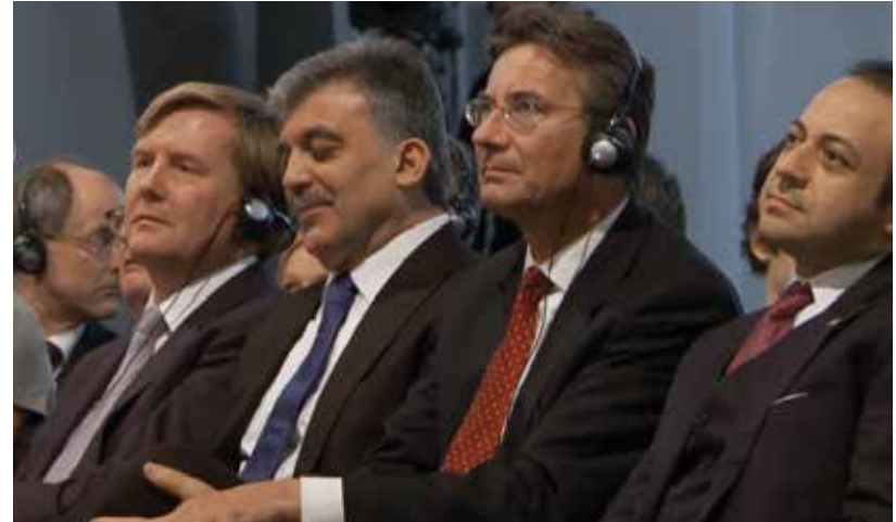
President Gül, Prins Willem-Alexander en Prinses Máxima op het business forum in de Amsterdam Passengers Terminal, april 2012 President Gül, Prince Willem-Alexander and Princess Máxima at a business forum, Passenger Terminal Amsterdam, April 2012

Ook voor Turkse bedrijven bood 2012 volop kansen. De meest in het oog springende gelegenheid was misschien wel de opening van het