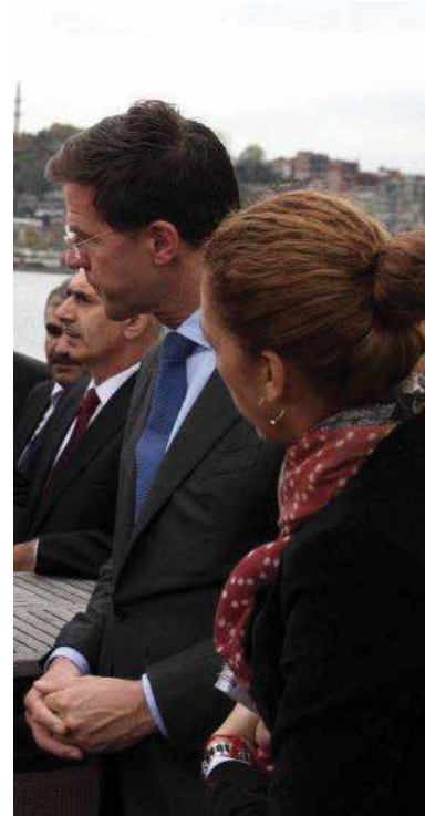
Prime Minister Rutte and Istanbul mayor Topbaş at the construction site of the Golden Horn Metro Bridge, November 2012

van premier Rutte aan een van onze projecten in Istanbul en het tekenen van een contract voor de ontwikkeling van een nieuwe OV-terminal op de oevers van de Bosporus.'