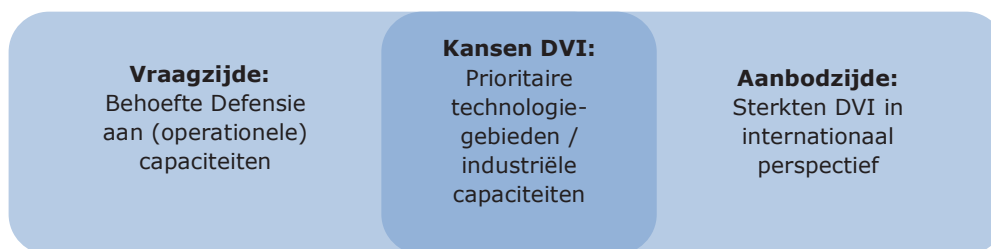
Figuur 3: Match van vraag- en aanbodzijde, leidend tot prioritaire technologiegebieden / industriële capaciteiten 10 .

Deze deelverzameling is kansrijk om de hierop actieve DVI te positioneren, in overeenstemming met de doelstelling van de DIS.