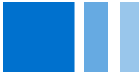
112 Blauw - PMS 285C

Mocht een andere variant wenselijk zijn dan kan deze schriftelijk worden aangevraagd via het contactformulier op www.rijksoverheid.nl