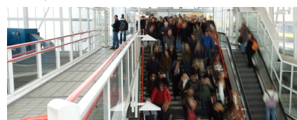
Spreiding van mobiliteit