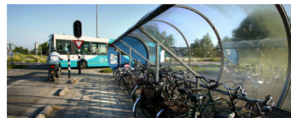
Voor- en natransport

Ook wilde het ministerie van IenM een aanjagersrol spelen bij het introduceren van kennismakingsacties, met als doel om nieuwe doelgroepen te verleiden om kennis te maken met de trein. Hierbij kan gedacht worden aan ouderen, jongeren of mensen die verhuizen naar een nieuwe gemeente. Verkenningen hebben veelbelovende ideeën opgeleverd zoals een voordeelurenkaart op (of bij) een Cultureel Jongeren Paspoort, een aanbod voor nieuwe inwoners van gemeenten (bij verhuizing) en een aanbod voor 'Nieuwe Nederlanders'. Deze ideeën zijn echter uitgewerkt op het