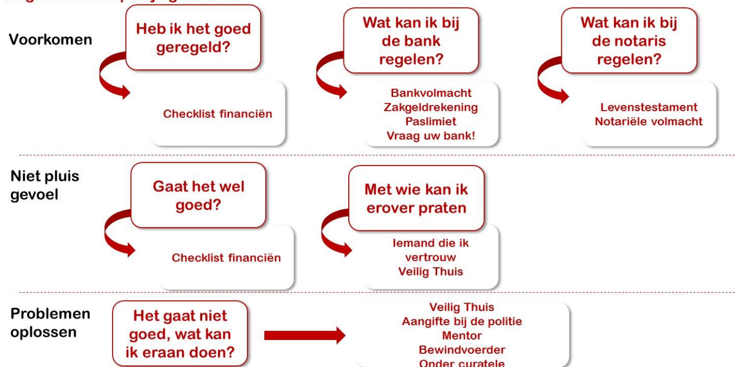
Bijlage 2: Stroomschema ouderen