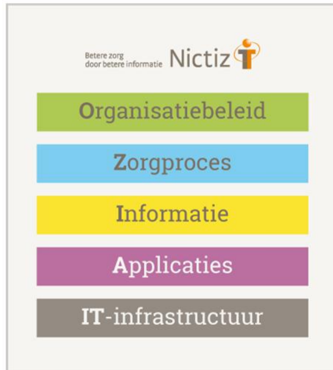
Afbeelding 1 - Vijflagenmodel voor interoperabiliteit in de zorg (Nictiz).

Organisatiebeleid: dit niveau heeft betrekking op de organisatorische kant van de samenwerking tussen de betrokken zorgorganisaties. Wie zijn er bij de samenwerking betrokken en hoe zijn verantwoordelijkheden en bevoegdheden gedefinieerd? Dit is van belang als zorgorganisaties onderling gegevens willen delen, maar ook als een zorgorganisatie gegevens wil delen met de patiënt: hoe richt de zorgorganisatie de verantwoordelijkheden in voor de ontsluiting van gegevens, hoe worden rechten en plichten van patiënten geborgd?