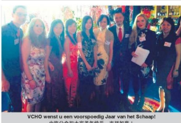
VCHO wenst u een voorspoedig Jaar van het Schape! 中伙公会祝大家羊年快乐，吉祥如意！

亚洲基础厨师培训课程 参加了此课程，您就符合亚洲餐馆协议的要求 Bureau HTM 在最近几年获得了许多关于亚洲餐饮业培训知识和经验。因此，通过与中伙公会合作，Bureau HTM 为中伙馆开设了一个完整的亚洲基础厨师培训。 这个课程为期2个月，包括理论和实践两个部分。老板可以通过 Bureau HTM 的教材，在这2个月的日常工作时间内系统地基本亚洲餐饮技术教授给员工。 此外，在这2个月培训期间，Bureau HTM 将为学生举办两次集体理论课程。二个月课程以考试结束。考试成绩合格之后，员工可以获得“亚洲厨师基本培训”证书。 请注意：参加的荷兰/欧盟公民需要符合以下其中一个资格： 现在还在餐饮业工作的人士； 目前在餐饮业工作的人士，让他能够提升到比较高级的职位（比如：洗碗工/提升为炒锅/厨师） 已经拥有经验或者受过职业培训的人士，以再培训成为亚洲餐饮厨师。此人可以从UWV前来的求职者。 如果老板需要多于一份符合协议的要求，就可以让更多员工参与这个课程。