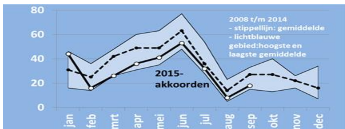
Figuur 2: Aantal akkoorden per maand, 2008 t/m 2015

Noot: Het aantal akkoorden voor de zomermaanden zal nog (iets) kunnen oplopen als later alsnog nieuwe akkoorden bekend worden.