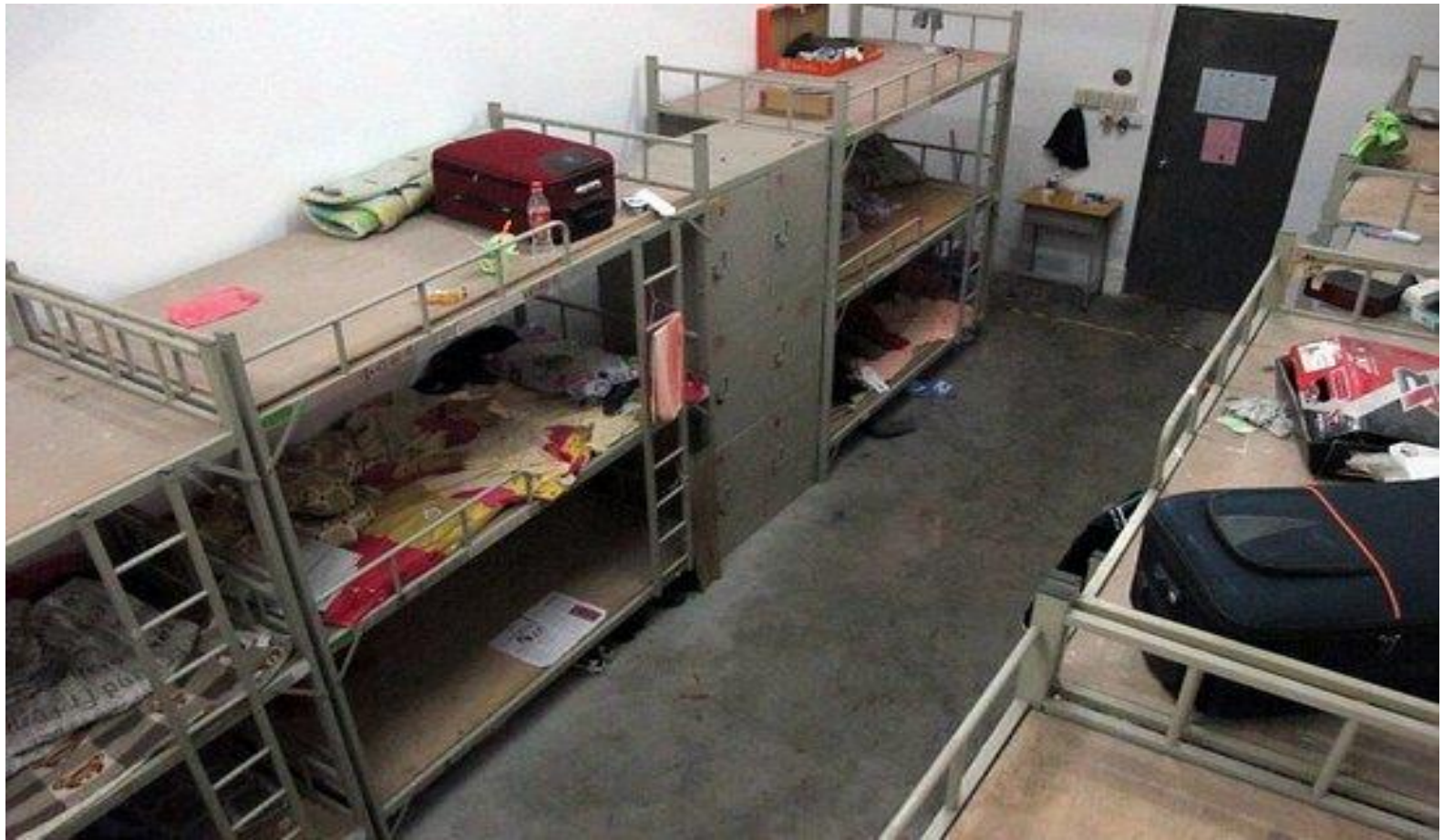
Armoedige slaapzalen voor migrantenarbeiders