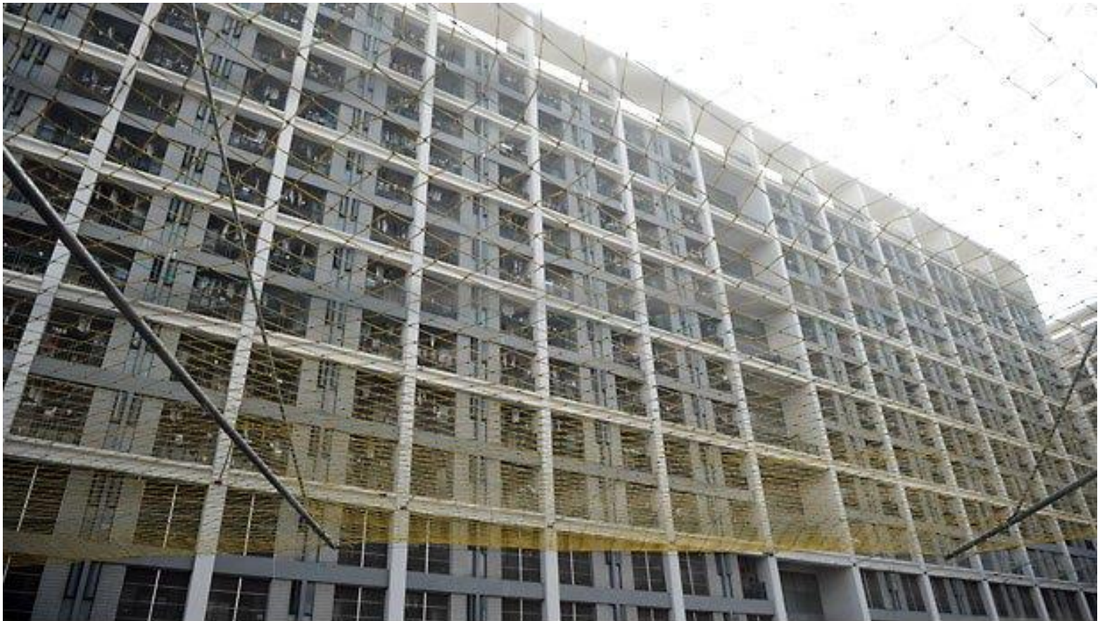
In response to suicides, Foxconn installed prevention nets at some of its dormitories.