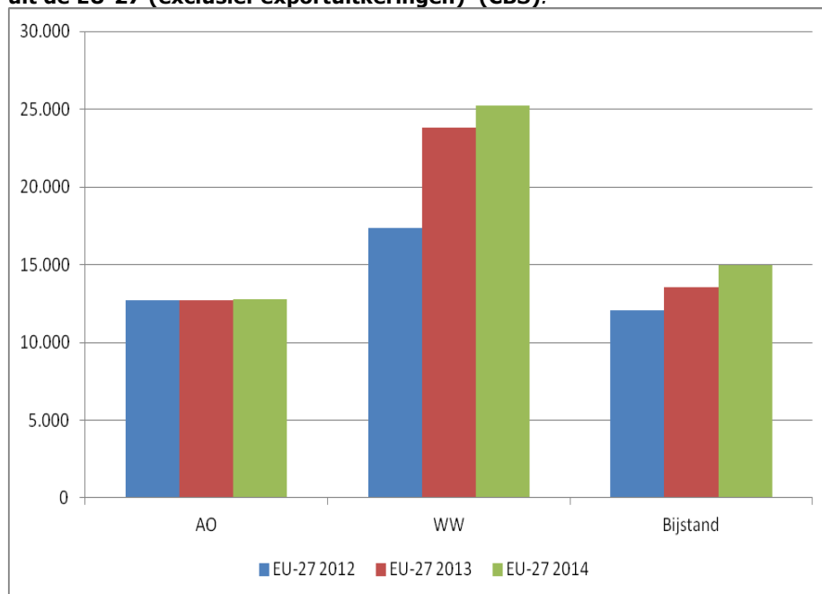
Figuur 3: Personen met een AO-, WW- of bijstandsuitkering 2012-2014 afkomstig uit de EU-27 (exclusief exportuitkeringen) 2 (CBS).